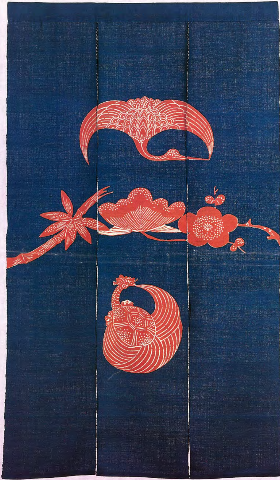
鶴亀に松竹梅文のれん(1959年)