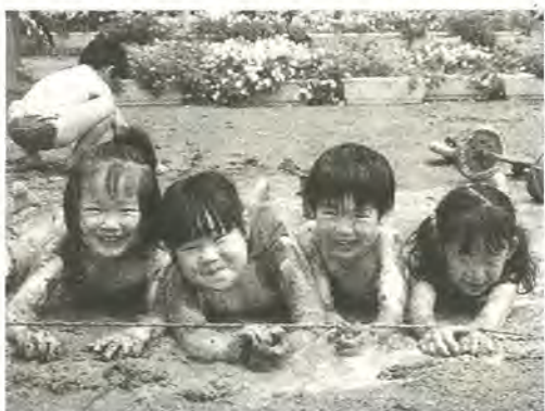
園庭には笑顔がいっぱい

対象 平成3年4月2日～平成4年4月1日に生まれ、市内在住または平成9年4月1日までに柏市に転入する予定がある幼児(※教育期間は平成9年4月から一年間です)