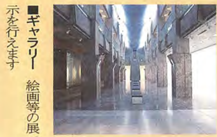
■ギャラリー 絵画等の展示を行います