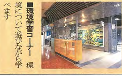
■環境学習コーナー 環境について遊びながら学べます