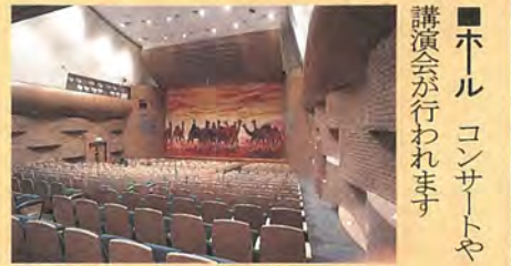
■ホール コンサートや講演会が行われます