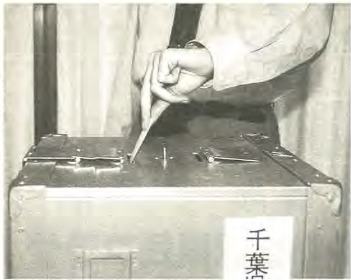
あなたの貴重な一票を大切に