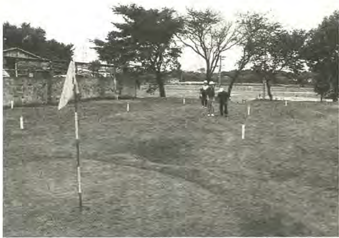
エチケットを守り、楽しいプレーを