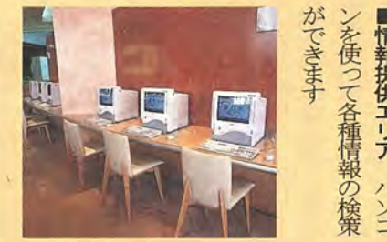
■情報提供エリア パソコンを使って各種情報の検索ができます