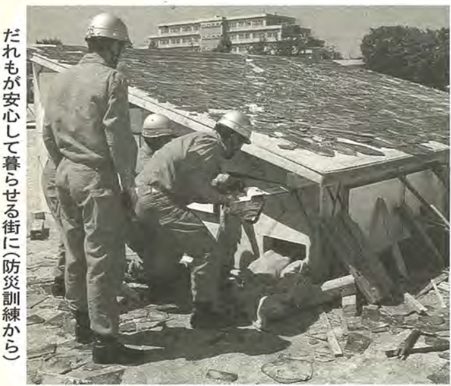
だれもが安心して暮らせる街に(防災訓練から)

今回の改訂でも、効果的にまちづくりを進めるために重点的、戦略的に取り組むべき事業をリーディングプロジェクトとして位置付けています。 新たに「災害に強いまちづくり」を追加し、従来の内容の組み替えを行いました。いずれのプロジェクトも、今後のまちづくりのために重要なものであり、長期的な視点に立って計画的な財政運営のもと、取り組んでいきます。 プロジェクト1 水と緑のネットワーク形成 利根川や手賀沼、大堀川等の水辺や周辺の緑を保全・活用することにも、拠点となる公園や地域の身近な公園などを整備します。さらにこれら を結ぶサイクリングロード・散歩道などを作り、公園や文化、スポーツ施設とのネットワーク化を図ります。 【主要事業項目】 水辺環境の保全と活用、手賀沼の水質浄化の推進、公園の整備、市民参加による緑化の推進 プロジェクト2 災害に強いまちづくり 大規模災害に対する総合的・体系的な地域防災計画を作成し、市民が安心して暮らせるまちづくりを進めます。 【主要事業項目】 災害に強い都市構造の形成、防災施設・設備の整備、防災体制の整備、災害復旧体制の充実 プロジェクト3 保健・福祉総合施策の推進 現在、問題となっている少子化・高齢化を念頭において、よりきめの細かい保健と福祉の総合的な施策の推進をめざしてまいります。 【主要事業項目】 総合的保健・医療・福祉サービス体制の整備、地域ケアシステムと地域福祉活動の推進、在宅福祉サービスの推進、子育て支援体制の充実、障害者福祉の充実、住み良い環境づくりの推進 プロジェクト4 生涯学習・文化・スポーツの環境づくり 個々の生涯学習活動やスポ