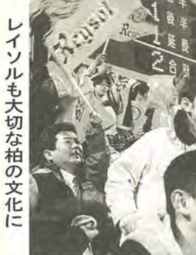
レイソルも大切な柏の文化に

○主要事業 市民参加のまち づくりを進めるふ るさと運動」に、 防災活動の育成と