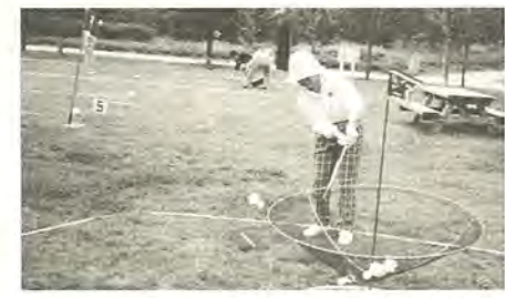
春季市民バレーボール大会の様子