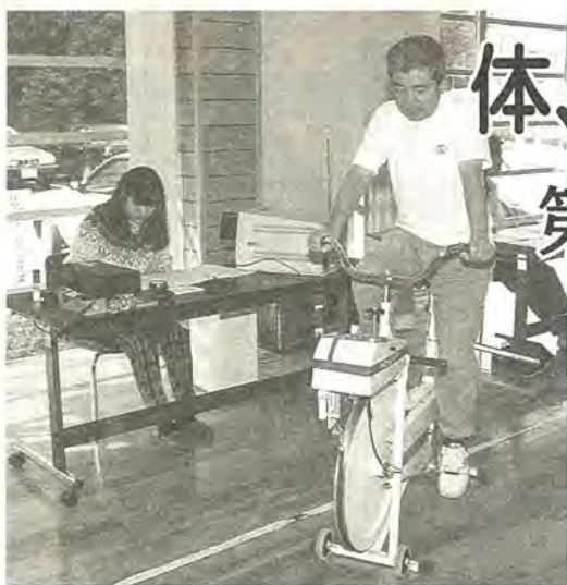
日々の努力が健康をつくります

「運動を始めたけれどやり方がわからない」「栄養には気を使っているつもりでも、これで正しいのか不安」。このようなために、市では中高年の皆さんの健康づくりをお手伝いする「健康増進事業」を実施しています。これは、医師などが専門的な立場から、運動・栄養等日常生活について、あなただけの健康メニューをともに考える「せいたくなも」。あなたも、健康づくりに挑戦してみませんか。