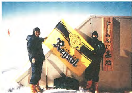
「レイソルを応援してます」-今回建設されたドームふじ基地の前で