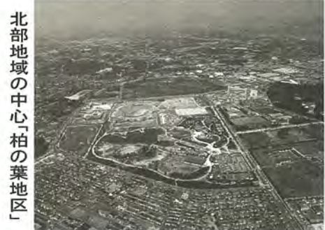
北部地域の中心「柏の葉地区」

プロジェクト5 柏駅周辺地区商業環境整備 商業や文化、その他の機能をバランス良く配置し魅力ある街に改善することも、訪れる人が歩きやすい歩行者空間の整備に努めます。 【主要事業項目】 広域商業機能の強化、交通基盤の整備 プロジェクト6 地域拠点づくり 常磐線の南柏・北柏駅周辺の両地区については、区画整理事業や再開発事業を通して駅前広場や道路を整備し、地域拠点にふさわしい街並みに整備してまいります。 【主要事業項目】 南柏駅東口整備事業、北柏 プロジェクト7 北部地域総合整備 常磐新線建設と併せて、単に鉄道の敷設だけでなく、新設予定の二つの駅を中心に、自然環境と地域整備が調和した計画的なまちづくりを行ってまいります。 【主要事業項目】 交通・情報基盤の整備、芸術・文化・健康ソーンの形成、高度な業務・研究機能の誘致、計画的な住宅地の整備 プロジェクト8 ふるさと運動の新たな展開 これまで培ってきたふるさと運動をさらに発展させて、市民一人ひとりの自治意識に支えられた行政と、市民参加によるまちづくりを目指します。 【主要事業項目】 快適な生活環境づくり、地域福祉の推進、地域防災のシステムづくり、地域文化活動等の支援、コミュニティ計画の策定、コミュニティの基盤づくり