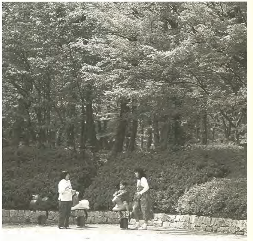
緑を守り、活用します