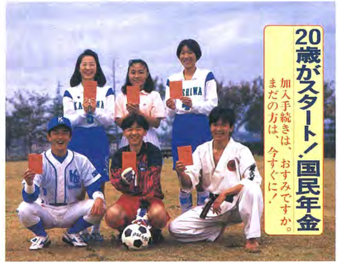
20歳がスタート/国民年金 加入手続きは、お済みですか。まだの方は、今すぐに！