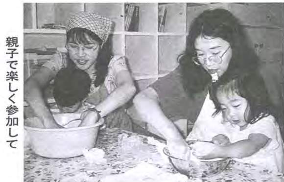
親子で楽しく参加して