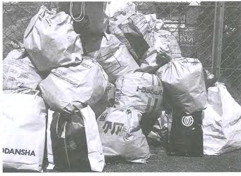
今日「成人の日」も収集します

祝日でもほとんどの場合は、ごみの収集を行っていることを存じますか？ 市では、ごみの収集や資源品の回収を、皆さんのお宅にお配りしている「ごみ出しカレンダー」の日程どおり行っています。 もう一度、あなたの「ご家庭の「ごみ出しカレンダー」を一覧になってみてください。 毎週土曜・日曜日は収集・回収を減らすため、とても大切に