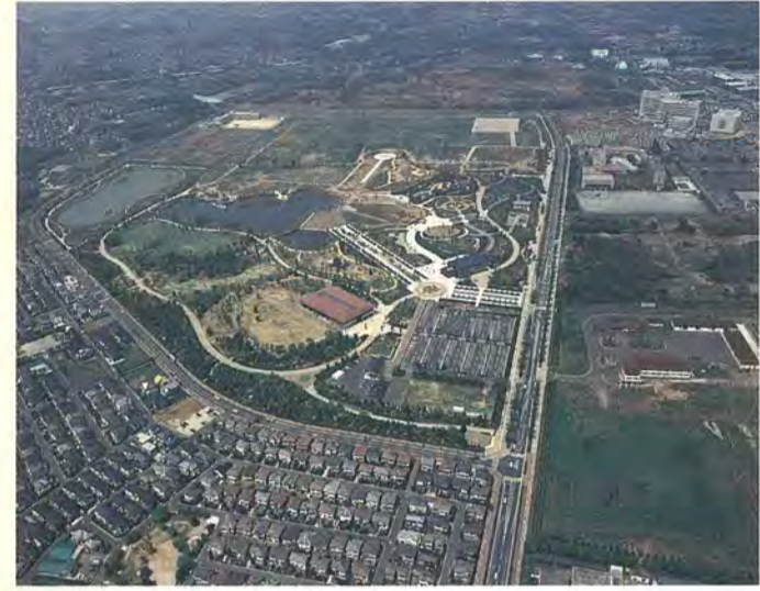
東大キャンパスが移転する柏の葉地区