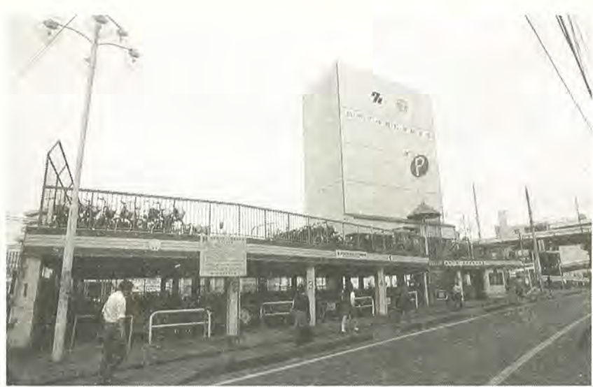
利用者を抽選で決める柏駅東口第1自転車駐車場

柏駅東口第一(千二百台収容)・同第二(二百四十台収容)・同第五(百三十台収容)の各自転車駐車場(別図参照)は、利用希望者がたいへん多いため、抽選で利用者を決めます。来年4月からの利用を希望する場合は12月21日(木)までに申し込みをしてください。 申し込み方法は、別表1のとおりです。 なお、登録手数料は別表3のとおりです。 利用の取り消し、利用駐車場・車種の変更を希望する場合は、12月21日(木)までに交通安全課へご連絡ください(別表2参照)。