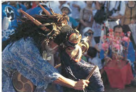
五穀豊穡(じょう)を祈る力強い獅子舞は迫力満点

豆科学者が研究 わくわく実験クラブ 「ドライアイスが溶けるとどうなるか?」「水になるのかな?」。7月20日に永楽台児童センターで「わくわく実験クラブ・ドライアイスのおもしろ実験」が行われました。コップの中の水にドライアイスを入れると白い煙がもくもく出て、参加した子どもたちは興味津々。最後には、ドライアイスを利用して自分たちで作ったアイスクリームを食べ、とてもうれしそうでした。