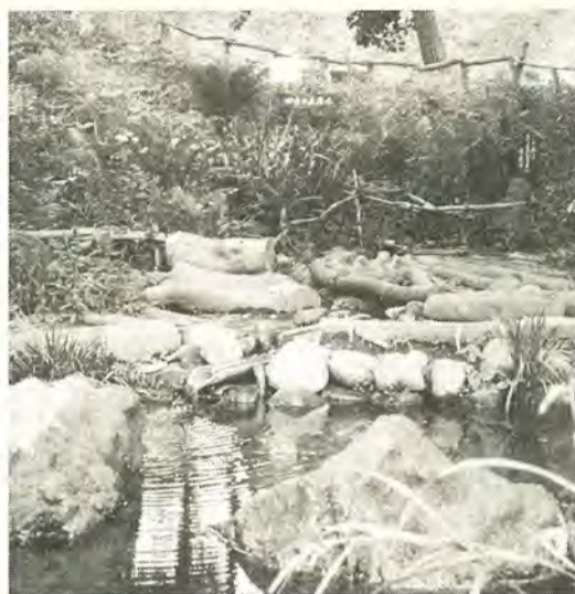
地元の皆さんが整備した四季の丘湧水

お気に入りの景観を見つけていただくため、今年も参加して、シャッターを「カシヤ」者を募集します。