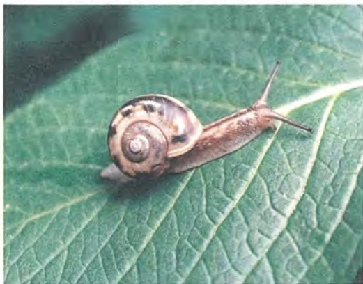
【ひつちメモ】 「カタツムリ」とは、陸生の巻き貝の総称。雌雄同体で、卵は土中に産む。寿命は二年程度。

家の中に閉じこもりがちなのこの季節。傘を片手に表に出てみませんか。いつもはなんとなく通り過ぎてしまう景色の中に、思いがけない発見があるかもしれませんよ。