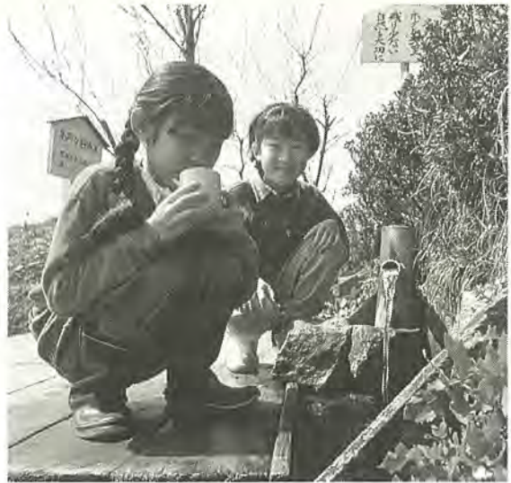
名戸ヶ谷湧水はみんなの宝

名戸ヶ谷湧水(ゆうすい)を募集します。周辺の湧水を対象に、家の屋根に降った雨を地中にしみこませる「雨水浸透ます」を設置していただく、モデル家庭を募集します。