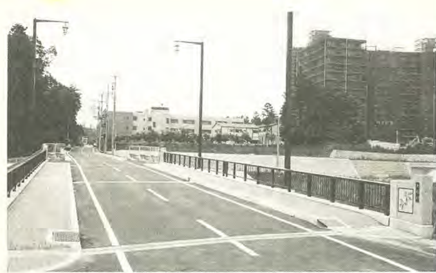
道路整備事業に伴い、新たに完成した木崎橋

阪神・淡路大震災や地下鉄サリン事件など、市民生活の安全をおびやかす災害事件が続いています。