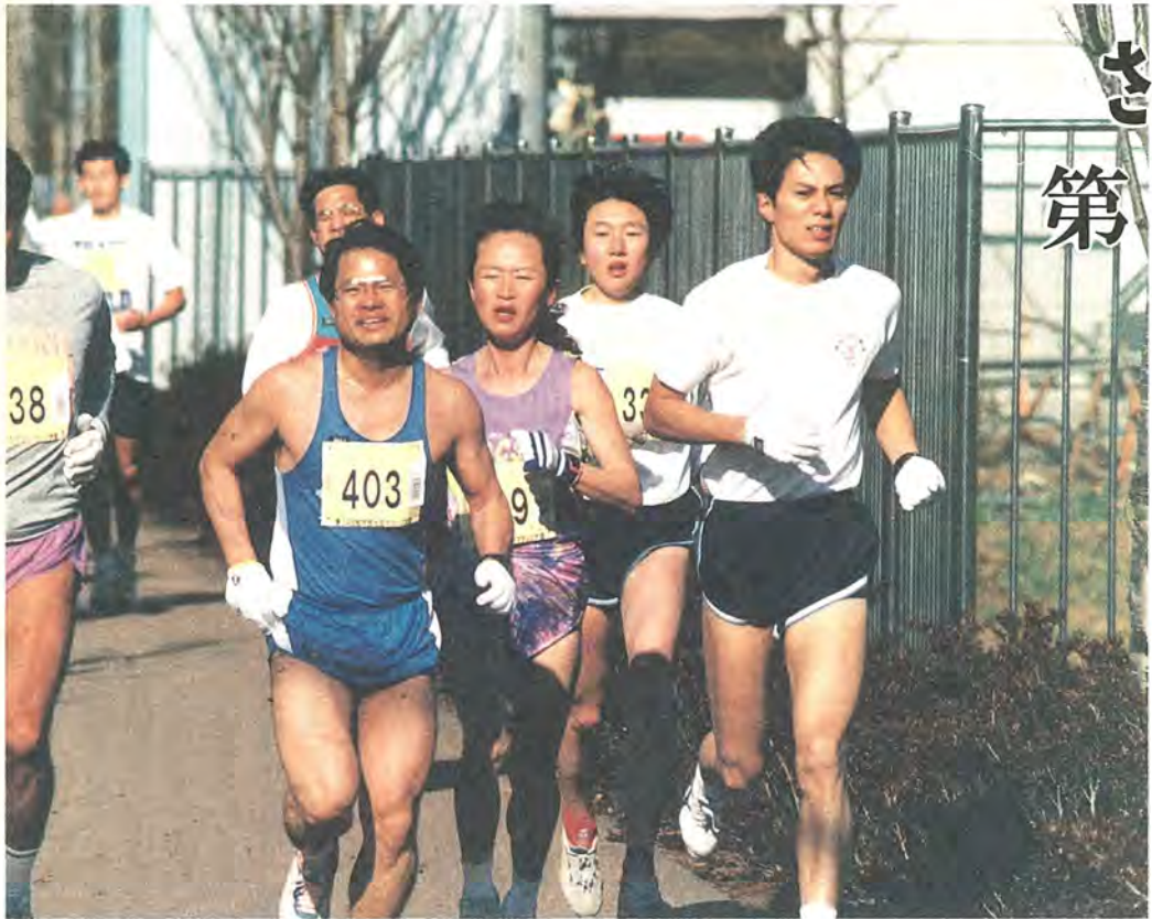
ゴールをめざして、走れ!走れ!(今年1月の市民元旦マラソンから)