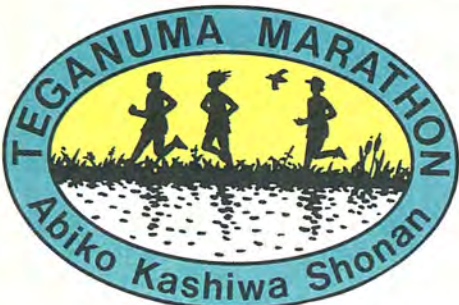
今大会のシンボルマーク

今回の手賀沼マラソンでは、参加費の一部が手賀沼浄化活動の資金にあてられます。将来的には、沼の再生に向けてのシンボリックな事業として、また近隣のスポーツ愛好者が大きな目標とする大会に成長していくことが期待されます。