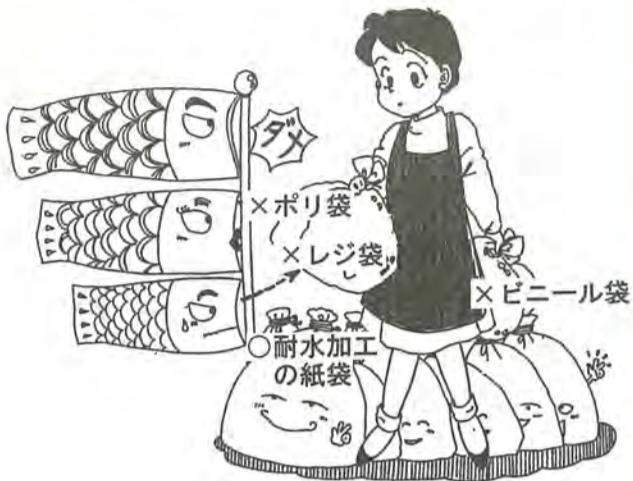
図 清掃収集事務所 ☎73-5111