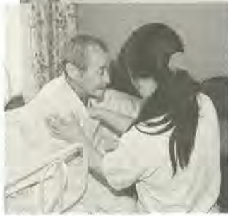
入浴前後の健康チェック

み立て式の浴槽を部屋に運んで組み立てます。この間わずか十分程度。準備が整うと浴槽に入り体を洗います。入浴後は再び健康チェックを行い、約一時間の「おふろ」が完了します。