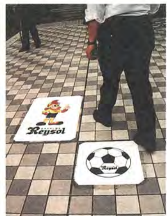
ボクをたどって来てね

柏駅東口から日立柏サッカー場まで の「レイソルロード」(一・三キロ)に、 レイくんとボールのシールがはられ、 サッカー場への道案内をしています。