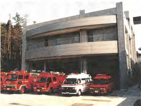
40トンの貯水槽も備えています

東部消防署の逆井分署が南 部近隣センター前に完成し、 四月から業務を行います。逆 井分署は、これまで奥津市川 ・柏線沿いにあった増尾分署 が、名称を変えて移転したも のです。延べ床面積千七百七十 一平方メートルの鉄筋コンク リート造り四階建てです。 新しい分署は、消防 車二台、救急車一台な どのほか、市内の消防 署で初めて、関東大震 災クラスの揺れに耐え られる耐震性井戸を備 えています。非常時に は一分間に二百リット ルの水をくみあげられ ます。 南部地域の防災拠点 となる分署として、二 十四時間体制で業務に 当たります。 お問い合わせ 東部消防署逆 井分署 電話72-1503