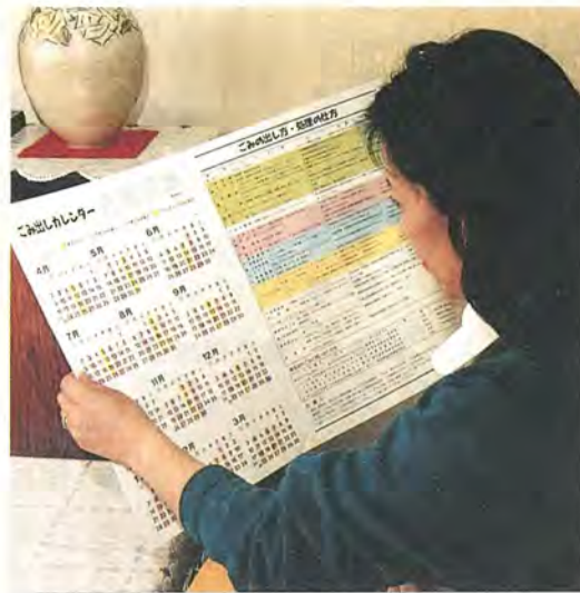
ごみ出しのルールはカレンダーを見て

今年には三連勝を果たした。 「去年は優勝ゼロでしたか ら、うれしいねえ。しか し、ときには鳩が帰って来 ないこともある。待ってい る間は心配ですよ。何年か 前に空が荒れて、飛ばした 十羽がみんな帰って来な かったことがあって、今日帰 るんじゃないか、明日には 帰るんじゃないかって、毎 日小屋にこもって待ったけ ど、とうとう一羽も帰って 来なかった」と今でも寂し そうだ。 「鳩があんな小さい体で、 津軽海峡を越えて帰って くる、何よりもその瞬間がた まらない」と、いとおいそ うに言う。優勝の話のとき よりも、ずっと優しい笑顔 になった。