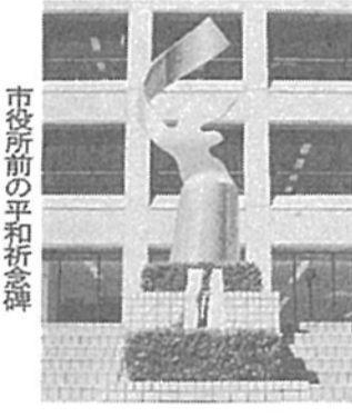
市役所前の平和祈念碑

ひと筆ごとに 思いを込めて 平和書道展 柏市平和都市宣言十周年と戦後五十周年を記念して「平和書道展」を開きます。この