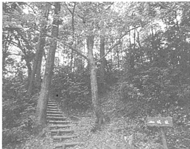
市内に残る大切な緑を守っていきます

平成七年度の予算は、一般会計が今年度当初予算に比べ、三・五%増の八百二億一千万円、国民健康保険事業など八つの特別会計が四百五億六千五百万円、水道事業会計が九十二億二千五百万円、病院事業会計が二十五億三千万円、予算総額では、千三百二十五億三千万円となり、前年度より四・二%の増となっています。