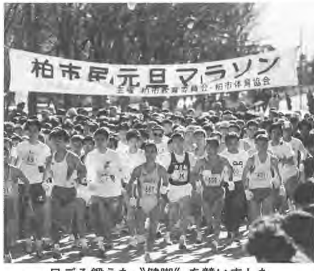
日ごろ鍛えた“健脚”を競いました

すがすがしい新年をマラソン 一月一日、新春のさわやかな青空の下、柏市民元旦マラソンがスタート!