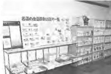
パンフレットも豊富

暮らしに役立つ情報のパネル展示や、パンフレットの配布、また図書・雑誌などもとりそろえています。ビデオの貸し出しも行っています。