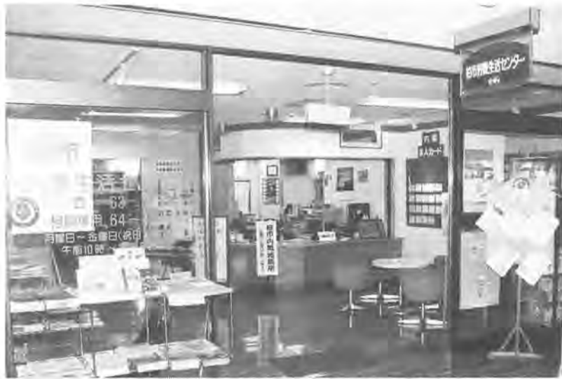
皆さんの生活を守る「暮らしの情報基地」

私たちを取り巻く消費者問題は、新しい悪徳商法が登場するなど、ますます複雑になっています。皆さんに安全な消費生活を送っていただくために設立された消費生活センターは、今年で二十周年。これからも「暮らしの情報基地」として活動してまいります。