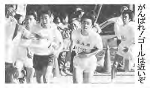
がんばれノゴールは近いぞ