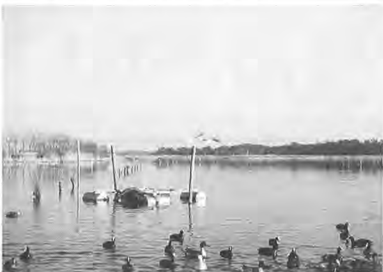
野鳥たちにも貴重な水辺の手賀沼

私たちが生活している地球は、環境問題を学ぶ「かしわ」そして地域の環境は、将来に「エコ・カレッジ(後期)」を開こうとしているのか。市で、きます。