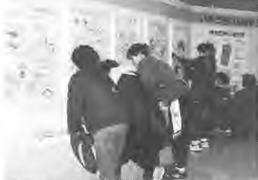
生活のヒントがたくさん(昨年の同展)

状況と問題点(柏市消費生活コーデイネーター) ◎今後輸入米が増えるなかで、米をいかに自給していくか(柏市消費者の会) ◎放射能や残留農薬が心配な輸入野菜・果物のかしこい選択(柏市生活クラブ)