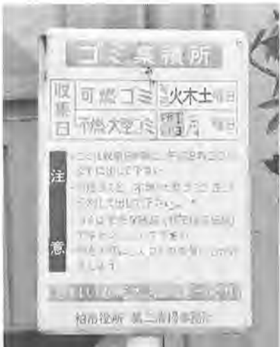
看板は外されますが、集積所の場所は今までどおりです

がある通りすがりの人にごみ「ほい捨て」され、集積所が汚される原因になるためです。撤去後も、集積所の場所は変わりません。 また、四月からのビニール・プラスチックごみの分別収集開始に先立ち、新しいごみの出し方と処理の仕方を掲載した「ごみ出しカレンダー」を皆さんにお配りします。このカレンダーには一年分の、各町会ごとの「ごみ出し日」と「資源品回収日」がわかり