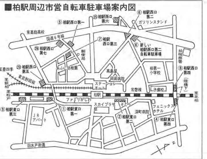
柏駅周辺市営自転車駐車場案内図