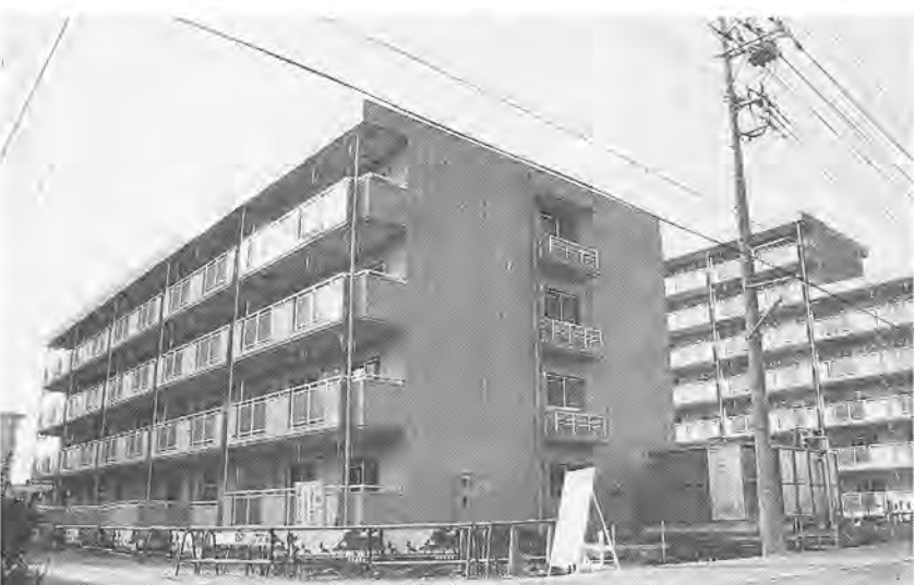
本体工事が完了した低層の市営住宅

また、北柏駅エスカレーター設置委託費と、市立柏高等学校庭球場整備工事を繰越明許費(注2)とします。第二清掃工場計画アセスメント(注3)委託事業などの五事業については、継続費(注2)の追加を行います。