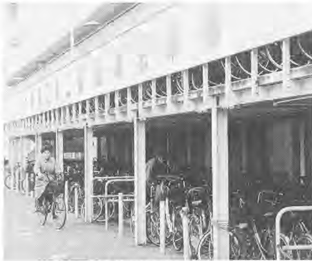
人気の高い柏駅東口第二自転車駐車場

柏駅東口第一・第二自転車駐車場(別図参照)は、利用希望者が多く、抽選で決定しています。来年四月から、柏駅東口の各自転車駐車場が日曜を除く午前六時から十時、交通安全課(市役所第一庁舎一階)が土曜・日曜を除く午前九時から午後四時半まで、申し込み方法の詳細は、別表1のとおりです。なお、この二カ所の駐車場は、お住まい・お勤めの地域によっては、利用できませんので、ご注意ください。