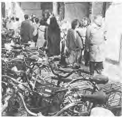
なくしたい放置自転車

しかし、駅周辺に放置されている自転車は、まだまだたくさんあります。放置自転車は街並みを見苦しくするだけでなく、歩行者が安全に歩くうえで、じゃまになります。また、消防車や救急車などの緊急車両の通行を妨げ、人命にかかわる問題を引き起こす