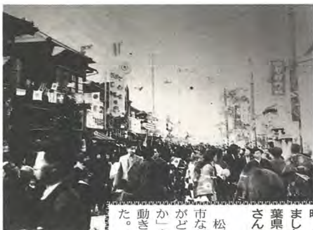
市制施行を祝って活気づく駅前通り