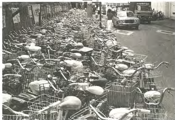
放置自転車が歩道を占拠していました