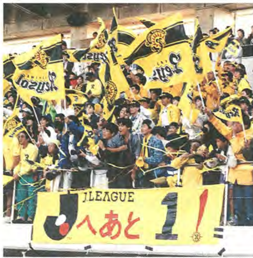
待ちわびたこの瞬間

将来については「まだ決めていませんが、航空気象台の仕事に興味があります。空港周辺に発生する局地的な気流の乱れが、離発着する航空機を危険にさらす場合があります。難しい仕事ですが、乗客の命と安全を守るため、やりがいがあります。でも、今はしっかりと勉強して卒業することが目標です」と笑って答えた。