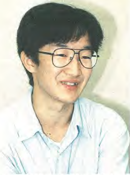
全国最年少の気象予報士