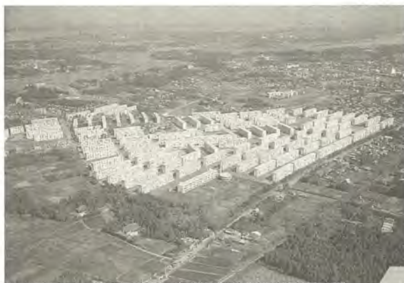
約一万三千人が入居しました

数字で見る40年① JR柏駅 1日の乗降者数 昭和29年……約20,000人 平成5年度……約315,000人