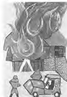
鍋田匡伴君の作品