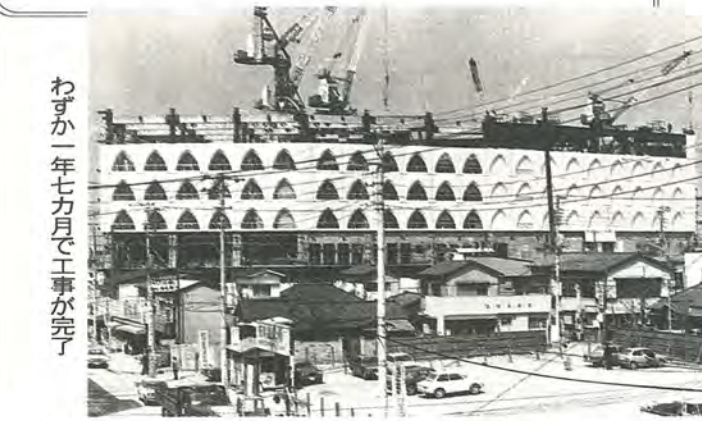
わずか一年七カ月で工事が完了

駅前は大改革……。この事業は、全国初の試みだったんです。だから見本もなく、試行錯誤の繰り返しでした。再開発区域内の住民の皆さんや商店のかたへの