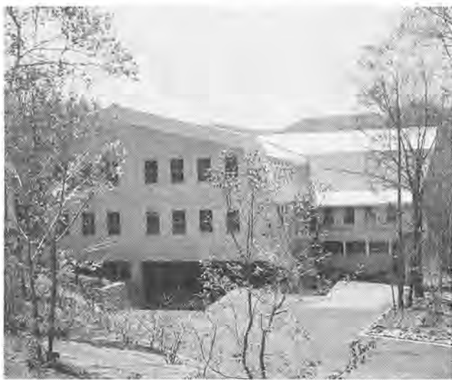
菅平では四季を通じて各種スポーツが楽しめます

柏市の市民保養施設「菅平（金）」来年1月4日（水）の宿泊分 申し込み期間 10月21日（金）～11月4日（金）の午前8時半～午後5時15分（土曜・日曜日、祝日を除く）申し込み方法 コミュニティ課（市役所第一庁舎二階）で申し込みます。申し込みは、抽選で利用者を決めますので、コミュニティ課へお申し込みください。 抽選の対象期間 12月23日