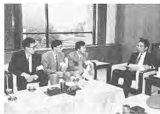
「日中消防協会友好関係」を締結以来、交流行事の一つとして行われているものです。研修生一行の日本での研修は、六月から来年三月までの約十カ月間。これまでは、浦和市・市川市・横浜市で研修を受けてきました。柏市での研修は、十月二十八日まで、主に予防関係（火災原因調査、査察等）と救急についての内容として行っています。

もう一度、社会に出て働きたい。そんなかたを対象に、「女性の職業生活準備セミナー」を開催します。内容は、「女性の職業生活準備セミナー」の書き方」「年賀状」など 費用 千円（教材に、新しい生活への糸口が見つかるとは限りません。 とき 10月15日～12月17日