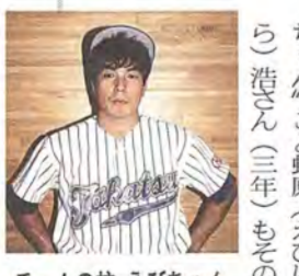
チームの柱・えびちゃん

市場で働く経験のおかげで、最初はきつかったけど、今は体が慣れました。年の差はあまり感じません。息の合った仲間との練習が楽しい。心が通合しているからスポーツって好きなんだよね」と笑う。