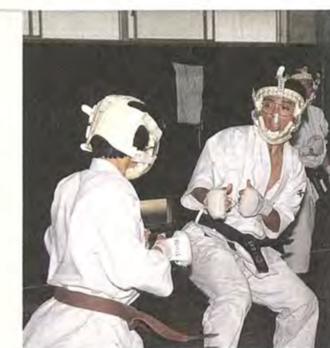
鋭い突き・けりが次々と繰り出される