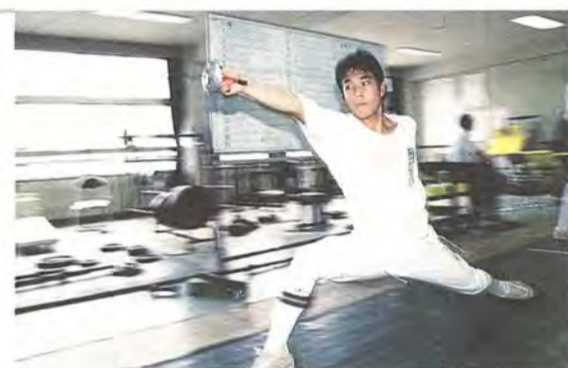
技とスピードで勝負