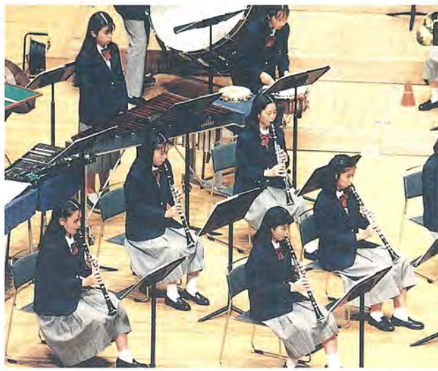
部員の心がひとつになった「金賞」の演奏

役割をまっとうするのだ。こんな自然の壮大なからくりには、人類がこれまでに蓄積してきた科学の力で立ち向かうしかない。「ところが、今のエイズ対策は、政治や社会観念だけで動いているんですよ。その科学をも越えて、病気に打ち勝つのに必要なのは、『患者さんの『治つ』とする精神力』と云う。そして病と闘った結果、力尽きたとしても、その死は人類の『未来』において決して無駄にはならない。「そう考えると、死は怖いことでも、敗北でもないんです。多くの生命の最期に立ち会い、そのたびに『輪廻』を目的に生きてきた氏の実感である。