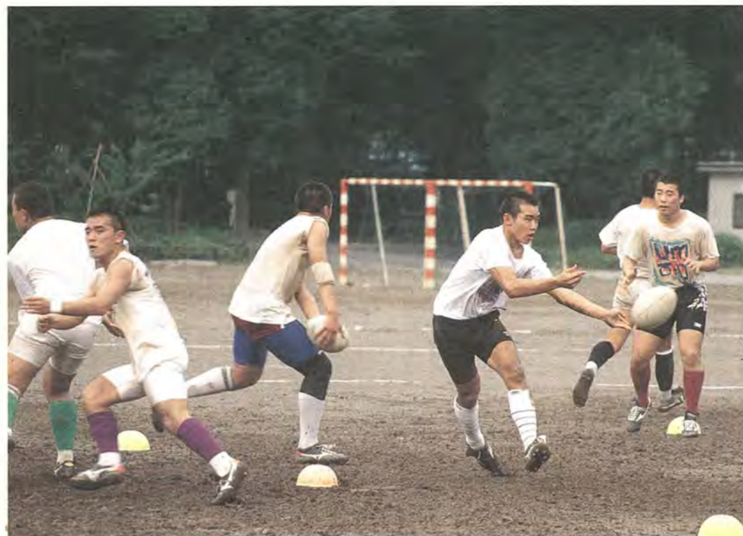
パス練習では目にもとらぬ速さでボールがまわされる

「大きい相手に向かってきたら、先ずは構い、当たってはいかない」とあくまでも勇敢だが、少し伸びたひげに目を凝らすと「相手に威圧感を与えるように」と照れくさそうな答えが返ってきた。