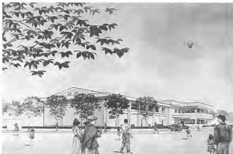
旭町近隣センターの完成予想図

旭町地区のふるさと運動の拠点として、旭町近隣センターの新築する請負契約を、三億九千四百四十九万円で締結(含)して、出産育児一しようとするものです。