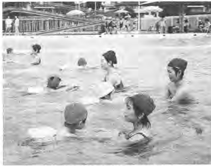
暑い夏には水泳がいちばん

早いものです。この教室では、最初は水遊びから始めて、水に慣れてからプールに入ります。まったく泳げない