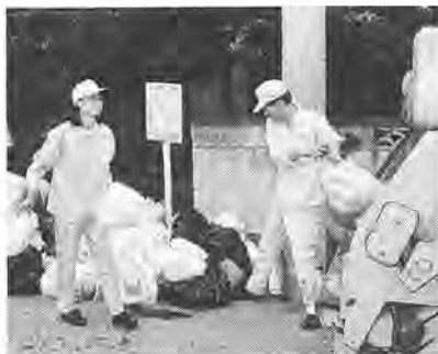
「ごみ問題を別の角度から」

「ごみ処理の最前線」の収集作業を体験する「ごみ収集」が、六月二十九日から七月一日に行われました。一人一日ずつ収集車に乗車し、男性十四人、女性九人の計二十三人のかたが参加しました。