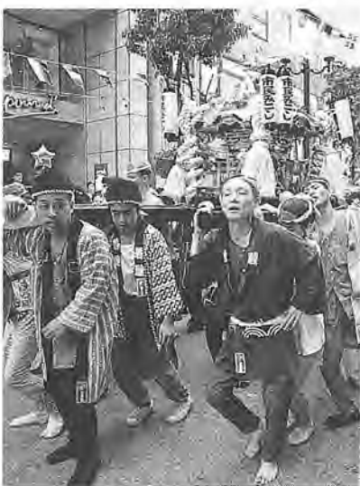
まつりだ、ワッショイ!

柏の夏の風物詩と言えば、3時〜5時(出場者は正午集合)「柏まつり」。今年は、七月三十日(土)・三十一日(日)の両日行われます。 このまつりに、花を添える「ミス柏コンテスト」、「みこのかつぎ手」、柏レイソルのマスコットキャラクター「レイくん」の花自動車といっしょにパレードするちびっ子サポーターを募集します。 パレード終了後には、「ちびっ子サポーターコンテスト」も開催します。 今年も、あなたも「まつりの一員」になりませんか。 【ミス柏コンテスト】 とき 7月30日(土)午後