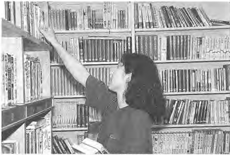
図書館はさまざまな情報の宝庫

▽身体の不自由なかたへの郵送・宅配サービス 身体障害者手帳(一〜二級)をお持ちのかた、ねたきりのお年寄りのかた、そのほか、図書館に直接来館できない身体の不自由なかたに、本や録音テープを、郵送などで貸し出しています。一人につき図書は十冊、録音テープは三本までで、貸し出し期間はそれぞれ一カ月です。 ▽オンライン・システム「ケンサク君」 図書館に希望する本があるかどうか、ある場合は、どの図書館にあるのか。また、その本が貸し出し中かどうかを自分で調べることができる