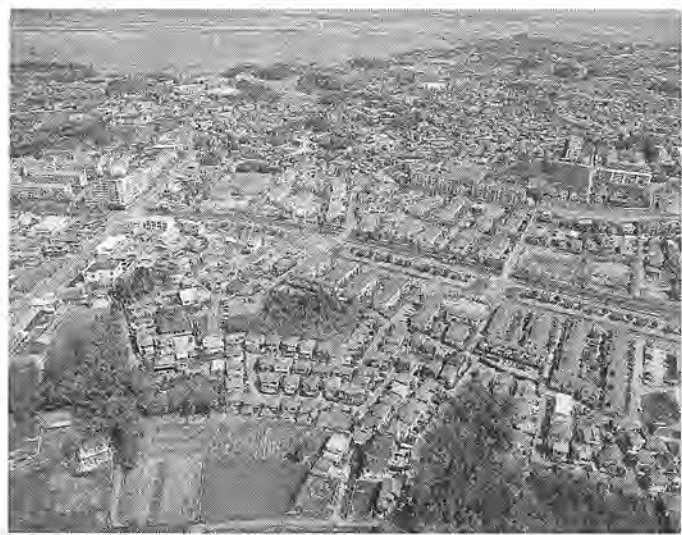
固定資産税は豊かなまちづくりの貴重な財源

①地価公示価格(国土庁土地鑑定委員会) ②地価調査価格(都道府県) ③相続税評価額