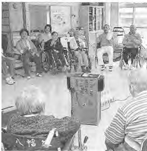
仲間と楽しく(デイサービスでの一コマ)

柏市周辺の六カ所の老人ホーム 対象 おおむね六十五歳以上の在宅の老人で伝染性疾患のないかた 費用(日額) 特別養護老人ホーム 二千九百円 養護老人ホーム 千六百二十円 申し込み 高齢福祉課(市役所第一庁舎二階)で配布している所定の申込書・診断書を持って、高齢福祉課へ送付して登録しているかたへは、平成六年度の更新用の書類を送りました。引き続き利用を希望するかたは、申請書類を持ってください。