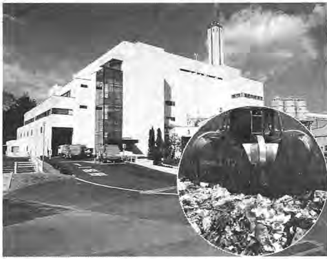
清掃工場のピットはごみでいっぱい

今年も残すところあとわずか。皆さんの自宅では、もう大掃除はお済みでしょうか。これからかたは、できるかぎり早めに済ませるようお願いします。 通常の3倍のごみ 毎年、この時期は一年のうちで、最もごみが多く出されるころ。このため、入りきらないごみを、最終処分場に仮置きしなければならなくなり、周辺のかたにたいへん迷惑をかけてしまいます。