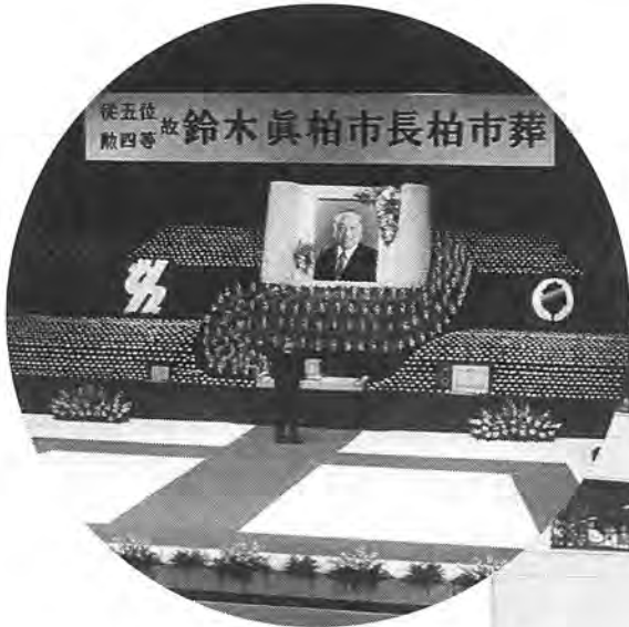
従五位 贈四等 故鈴木眞柏市長柏市葬

■柏市葬と市長選挙 急逝した鈴木市長の市葬を、10月27日に挙行。11月に行われた柏市長選挙で、本多晃氏が当選しました。