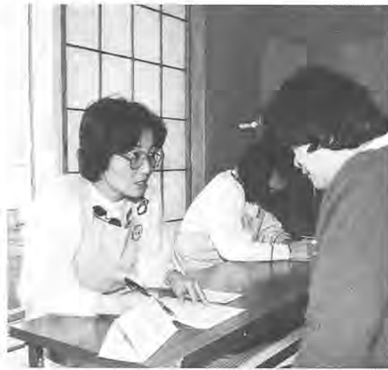
早めのチェックが肝心

※申込締切日はいずれも消印有効です ※締切日を過ぎて申し込まれた場合、受診は平成7年度からとなります