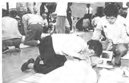
突然の事故に備えて

「もしもし、もしもし、だいたいじょうぶですか?」「意識がありません!」 第一回普通救命講習会が、十二月十日に消防本部で行われ、市民のかた五十一人が参加しました。