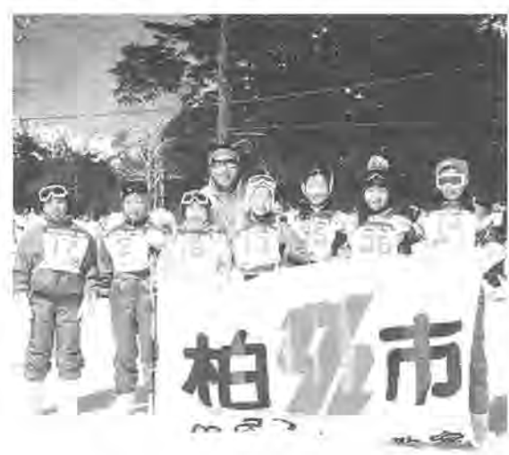
白い雪の中、新しい友だちもできるよ

冬のスポーツといえば、な 山には雪がどっさり、白銀の んといつてもスキー。小学生 世界で、すばらしい思い出を と勤労青少年を対象に、二つ 作ってみませんか。 【小学生スキー教室】 とき 来年2月10日(木) 13日(日)の三泊四日。2 月10日(木)午後6時に市民 体育館を出発。とろろ 日光 湯元スキー場(栃木県) 対 象 小学四年生～六年生、四 十人 宿泊施設 奥日光高原 ホテル 交通機関 往復とも 貸し切りバス 内容 スキー の安全な滑り方・雪上ゲーム など 費用 三万円 申し込み み 12月23日(木)午前10時 10時半に、申し込み金一万 円を添えて市民体育館へ。代 理申し込みは、一人一家族分 まで※応募者多数の場合は抽 選