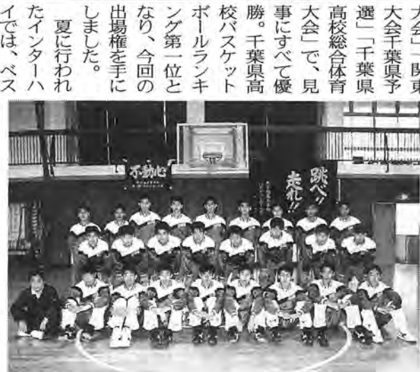
優勝を目指し、跳べ/走れ!

市内最終のごみ収集を、別表1のとおり行います。年始は一月五日(水)から、平常どおり収集します。