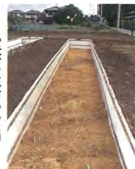
もみガラを敷きつめた畑

あなたは、根イモを食べたことがありますか。「食べたことがない」というかたも多いのでは。根イモとは、里イモのくき、一般に「ずいき」といわれるものです。ただし、普通の「ずいき」とはだいぶ違います。一メートル程の長さのもみガラの中に、里イモを収穫した後の種イモを植え、これに水を与えて新しい芽を成長させます。もみガラの中で日光に当てずに育てるので色が白く、見た目は「ウド」に似ています。昔は、柏市以外の市町村でも作られていたようですが、現在、売られている「根イモ」のほとんどは、市内の主に篠籠田地区で生産されているものです。