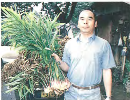
掘りたてのショウガは良い香り

市内で栽培されているショウガは、その多くが生のまま食べられる葉ショウガです。市の南部地区で多く栽培されていて、特に逆井・藤心のものが有名です。十年ほど前から作付けが増え、東京への出荷も増えてきています。東京の市場での評価も高く、「柏の葉ショウガ」という名前はかなり浸透しています。市内には三十六ヘクタール作付けされていて、品目別の作付面積としては、八番目に多く、生産高では五番目に多い重要な作物です。