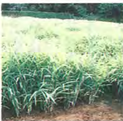
南部地区のショウガ畑

市内で栽培されているショウガは、その多くが生のまま食べられる葉ショウガです。市の南部地区で多く栽培されていて、特に逆井・藤心のものが有名です。十年ほど前から作付けが増え、東京への出荷も増えてきています。東京の市場での評価も高く、「柏の葉ショウガ」という名前はかなり浸透しています。市内には三十六ヘクタール作付けされていて、品目別の作付面積としては、八番目に多く、生産高では五番目に多い重要な作物です。