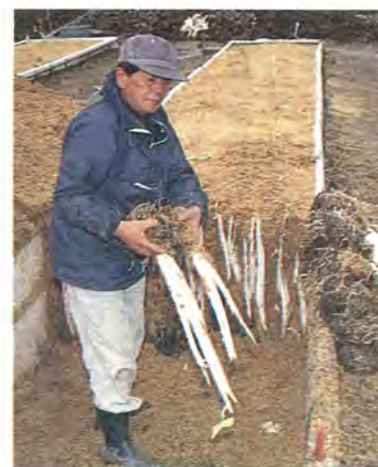
根イモの掘り出し作業