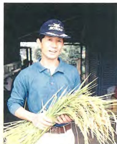
今年の出来はまあまあ

市内でも大規模に水田として利用されているのは、利根川沿いの利根遊水地です。柏市の農地のほとんどは、火山灰土壌がその影響を強く受けた土壌です。しかし、このあたりでは、利根川が上流から運んだ土砂によって形成された沖積土壌が広がっています。沖積土壌は肥よくて、また利根川の水と地下水を利用することによって、良質の米が作られています。昨年、千葉県代表として皇室に献上されたお米もここで作られました。