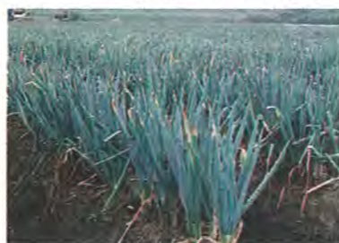
富勢地区に広がるネギ畑