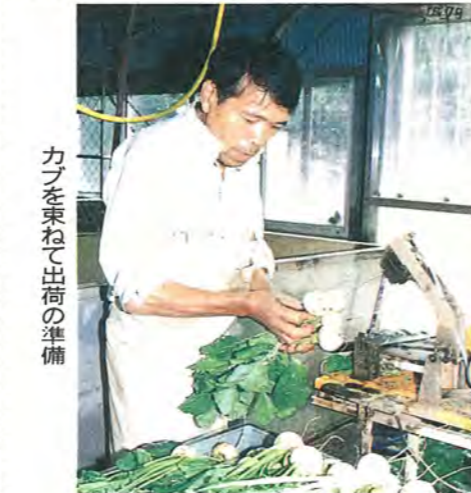
カブを束ねて出荷の準備