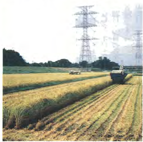
柏の水蔵「利根遊水地」