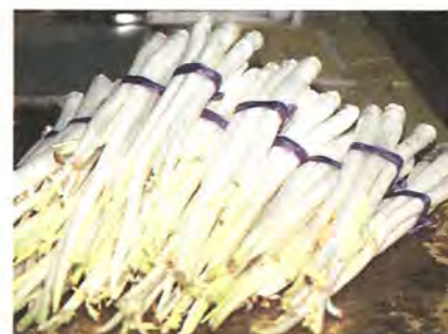
「ウド」に似て色は白い