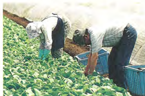
見事に成長したチンゲンサイ