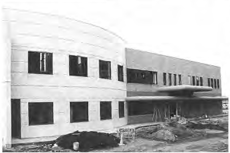
完成間近の(仮称)南部老人福祉センター

柏市老人福祉センターの設置及び管理に関する条例の一部を改正する条例の制定について 二カ年継続事業で建設を進めてきた老人福祉センターの市営北柏第二工区(D棟)十月末完成に伴い、名称を「新築工事(建築工事)」と根拠「柏市南部老人福祉センター」四一一番地の二に鉄筋コンクリート造り四階建て、十八番地の二に定めるため、戸、延べ面積千三百九・六五