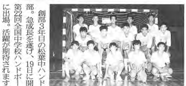
チームのまとまりが武器

20日から始まった第15回全国中学校軟式野球大会に出場している田中中ナイン。固い守備、機動力を生かした攻撃で「目指すは優勝」。