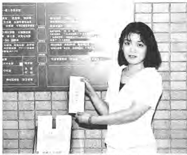
みなさんの「声」をお待ちしています

この制度は、昨年の七月一日、それまでの「市民の声ポスト」を郵送方式に改めたもので、市役所や近隣センター、市内各駅(柏駅を除く)に用意してある「市長への手紙」が直