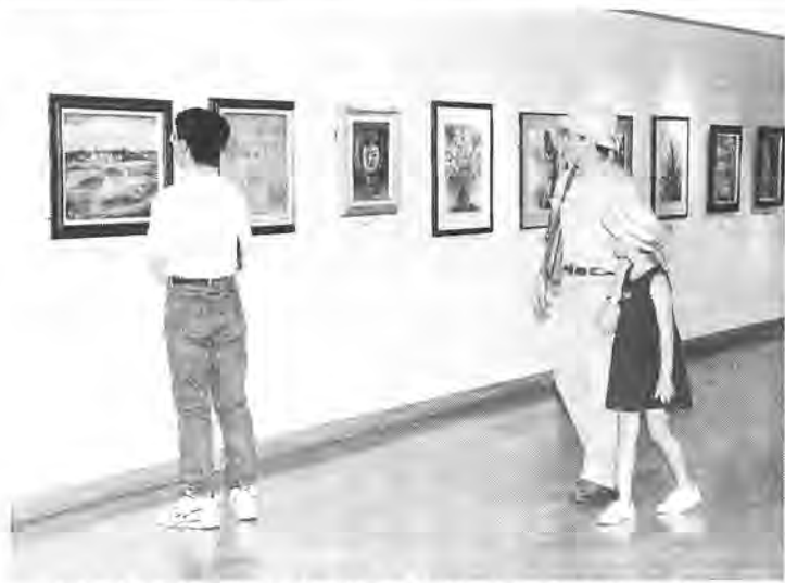
いろいろな催しに多くの人を訪れる市民ギャラリー