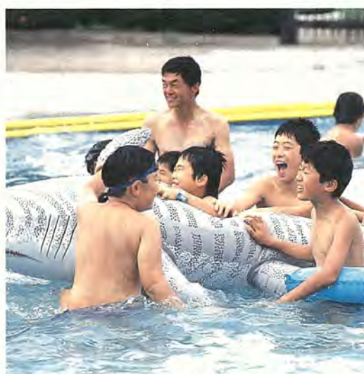
みんなで泳げばもっと楽しい!

今年もいよいよ、市内四方 開きは七月四日(日)です。所の市民プール(別表)がオ 夏はキャンプや海水浴な プーンします。今年のプール ど、活動的なレジャーを楽し と泳ぎしてみませんか。利用の際には、次のことに