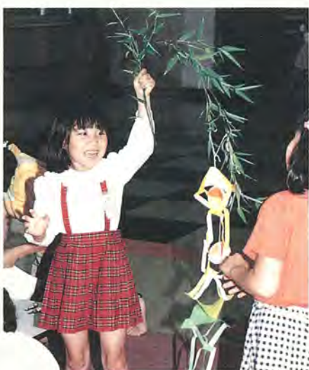
作り方もばっちり覚えたよ

期間 7月2日(金)から約1カ月間 ところ あけぼの山公園ふるさと体験農園地区内 料金 1株100円(5株単位) ※団体は事前にふるさと農園トマトハウスへ予約してください 8月~秋ごろには、トウモロコシやサツマイモなどの収穫体験の予定もあります 問い合わせ ふるさと農園トマトハウス ☎34-9920