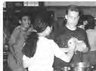
力を合わせて夕食作り

立流山青年の家 対象 市内在住・在学の高校生以上の学生、四十人 内容 室内レクリエーション・オリエンテーリング・夕食作りほか 費用 千五百円 申し込みはがきに①住所②氏名(ふりがな)③電話番号④学校名・学年を記入し、個人または