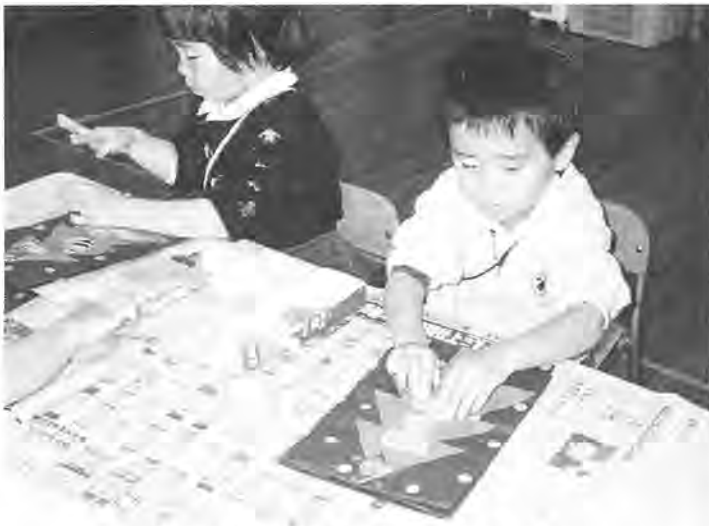
楽しい工作の時間もあるんだヨ!

逆井の一部地域(約〇・八六平方キロメートル、二千五百世帯が居住)別図(2参照)に今年八月一日から、住居表示が実施されます。