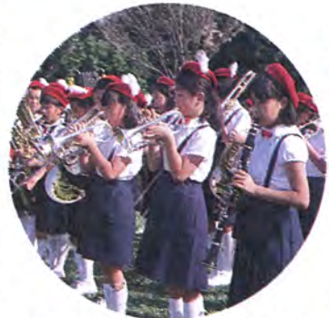
美しい音色を聞かせてくれました 余二第一公園までを十五基の子どもみこしが練り歩き、続いて行われた西原小学校・西原中学校両校のブラスバンドの演奏も、まつりに花を添えました。

りにまつりが始まり、近隣センター前でのパレードには、一方、二千人が参加して行われた西十余二地区まつり、と山車に参加し、まつり気分も最高潮。フィナーレの盆踊り大会へは、涼を求めてたく