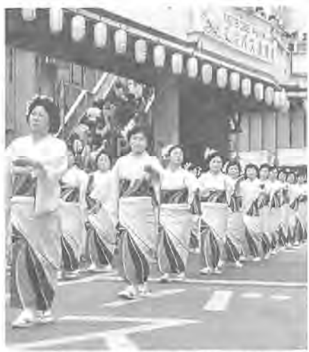
優勝をめざして(昨年の柏おどりコンテストより)

ミュージック& 花自動車パレード とき 1日・2日 午後2時15分～3時半 コース NTT一本町通り～駅前通り～スカイプラザ裏～サンサン通り～寺嶋駐車場 内容 市役所・市内企業などによる花自動車、市内小学校のマーチングバンド、パトカー・パトロール、アンパンマン仮装パレードなど