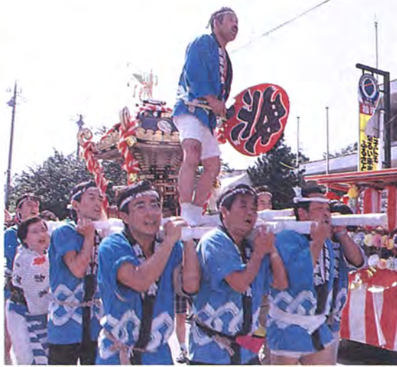
南部地区に元気な掛け声が響きわたりました

富勢地区、田中地区に続いて、開かれました。七月十八日・十九日の二日、南部地区まつりは、南部近隣センター、西十余二地区、隣センター、南部公園などを会場に開催。芸能大会を皮切