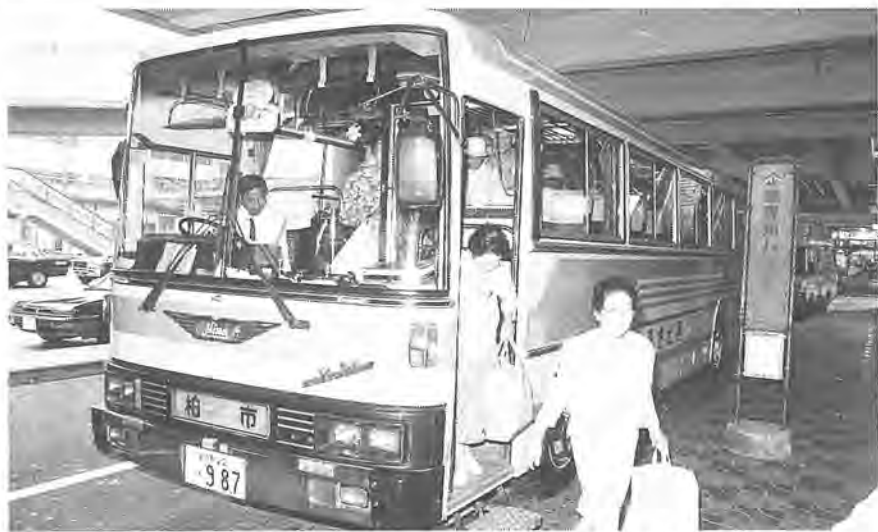
おおぜいの市民に利用されている福祉バス

期営業農地制度の廃止に法律が平成四年三月三十一日 伴い、市街化区域内農地に対する自治法に基づき専決処分し、税について、農地課税相当額を、仮に算定した税額として