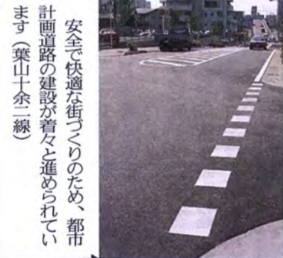
安全で快適な街づくりのため、都市計画道路の建設が着々と進められています(葉山十全線)