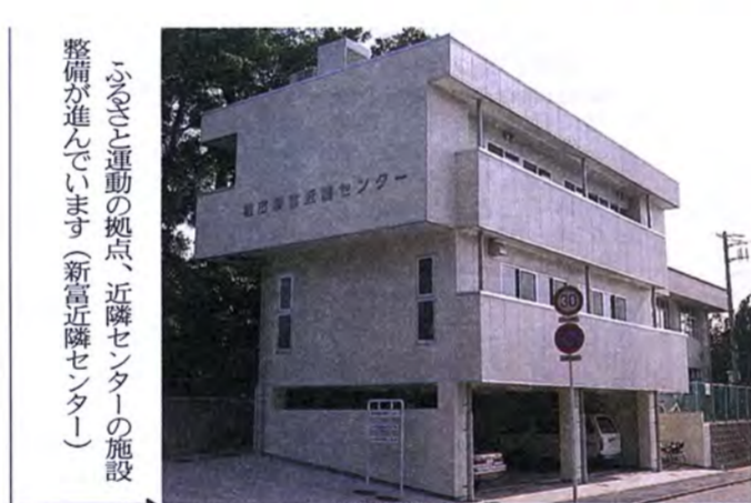
「心と運動の拠点、近隣センター」の施設整備が進んでいます(新富近隣センター)