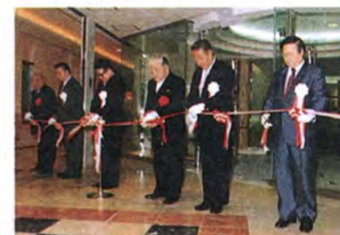
地域文化の振興を担う、市民ギャラリーが4月23日に新装オープン

主なごとの意味 一般会計 市の基本的な業務に必要な経費を計上した会計。使用目的別に予算が決められています。特別会計 特定の事業を行うため、一般会計と別して経理する必要がある場合、特に設けられる会計。国庫支出金 市が行う特定の事業に対し、国が支払うお金。 地方譲与税 国税として徴収され、そのまま地方公共団体に譲渡されるお金。市県交付金 県に納入された利子所得に対する税金から、市に交付されるお金。民生費 近隣センターの建設や障害者・老人福祉、保育園などの費用。公債費 市債の返済に使用される費用。