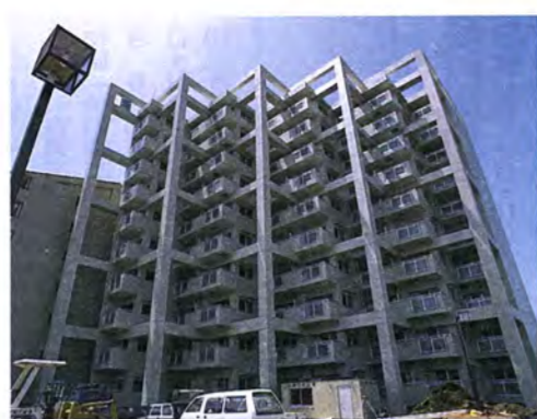
住宅に困っている低所得のかたの市営住宅の建設(完成間近の市営北柏)