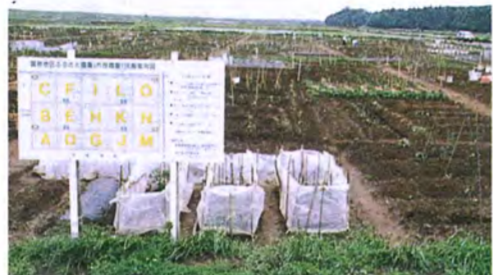
あけぼの山周辺整備事業のひとつ、ふるさと農園では、多くの家族が自ら耕し、野菜などを楽しく作っています