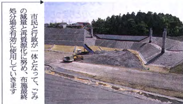
市民行政が一体となって、ごみの減量と再資源化に努め、布施最終処分場を効率的に使用していきます