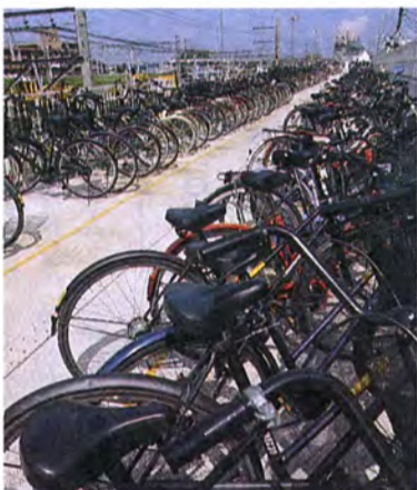
交通安全対策として、自転車駐車場の整備は欠かせないことできません(北柏駅南口で)

手賀沼の浄化対策事業は、市民の参加と協力で進めて行かなければなりません(クリーンピクニック)