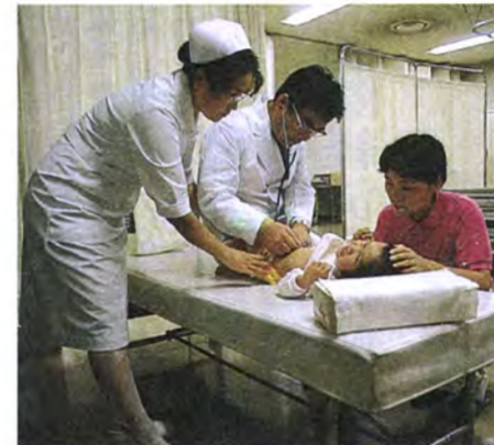
市民の生命と健康を守る365日夜間診療体制への補助

家族の介護や援助が必要な在宅のお年寄りへのデイ・サービス事業。入浴サービスもそのひとつです