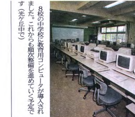
8校の中学校に教育用コンピュータが導入されました。これからは順次整備を進めていく予定です(光ヶ丘中で)