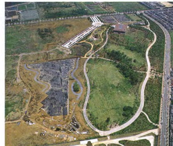
計画面積45ヘクタールの広大な県立柏の葉公園の建設にも費用を負担しています

市では、毎年6月と12月の2回、予算の執行状況、住民負担の概要、財産の現在高などの財政状況を公表しています。いわば「市の家計簿」の公開です。平成3年度予算ですめられた各種事業(一部は継続中)を写真で紹介し、平成3年度の下半期(平成3年10月~平成4年3月)の財政状況を公表します。