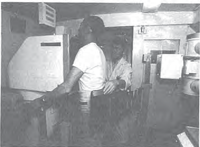
検診を受けて病気の早期発見・早期治療を