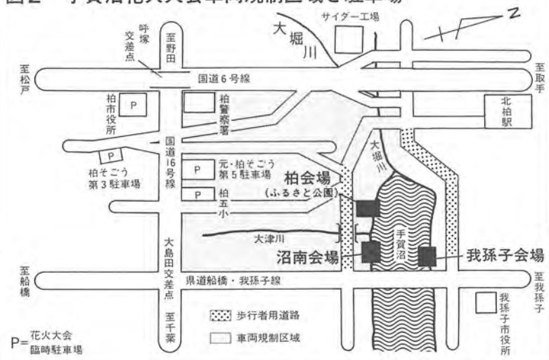
図2 手賀沼花火大会車両規制区域と駐車場