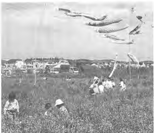
こいのぼりが泳ぐ中、レンゲ摘みを楽しみました