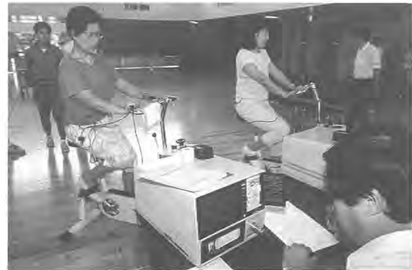
運動負荷心電図の検査 (昨年の健康増進事業から)

わたしたちは、豊かな緑と水をまもり、潤いのある住みよい柏をつくるためにこの憲章を定めます。 1 たがいに話し合っ、心のかよう明るい柏をつくりましょう 1 老人を敬い子どもを愛する、あたたかい柏をつくりましょう 1 環境をととのえ、安全できれいなまち・柏をつくりましょう 1 教育を重んじ、健康で、文化の薫り高い柏をつくりましょう 1 国際理解を深め、平和な柏をつくりましょう