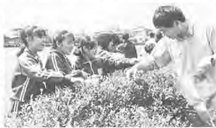
茶摘みには先生も参加

新茶の摘み取りの話が各地で聞かれますが、市内でも 田中中の茶摘み 全校生徒千人が参加