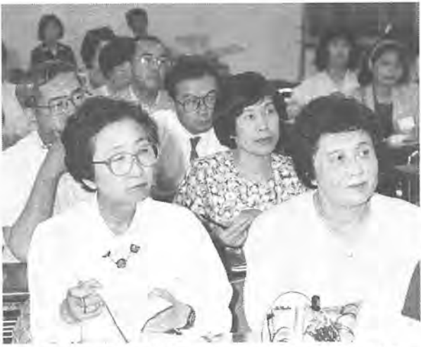
すべての市民が学べる生涯学習社会づくりを推進します(時事セミナーから)

すべての市民が意欲的に学び続け、そこに新しい市民文化が育まれるよう、総合的な生涯学習サービスネ