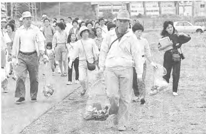
心のかよいあう住みよいまちをめざします(クリーンピクニックから)

の高揚に成果をあげてきています。今後は、更に地域の生活環境や環境保全、福祉、男女の共同参加による