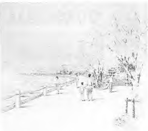
大堀川を市民の憩える一大拠点に(北千葉導水路環境整備計画から)

利根川、手賀沼、大堀川、大津川などの水辺と周辺の緑を保全し、市民が自然の中で憩える場として、