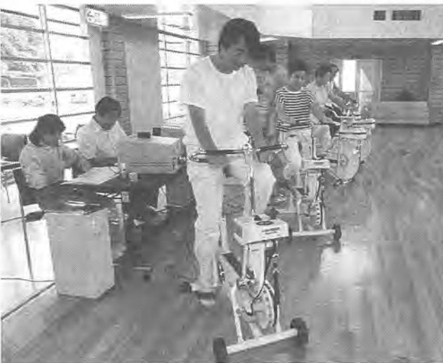
市民のスポーツ活動や健康づくりを応援します

やレクリエーションに親しみ、健康で活力に満ちた生活が送れるように、スポーツ施設の整備や、スポーツ・レクリエーション施設等を結ぶ遊歩道やサイクリングコースなどを整備します。また、健康づくりの知識の普及などをめざす健康増進施策の充実を図ります。