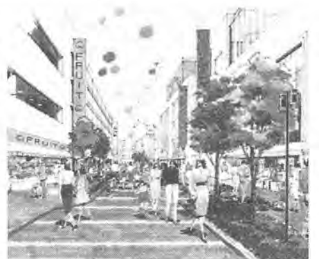
柏駅東口周辺地区再生計画イメージ 確保しながら、さらに吸引力を拡大していくために、特色ある専門店街等の商業や文化施設などの機能強化と道路・駐車場などの施設整備を推進します。

一千ヘクタールを対象に総合的な市街地整備を推進することとしています。この総合整備では、単に大量の住宅を供給するだけでなく、質の高い住宅地の形成