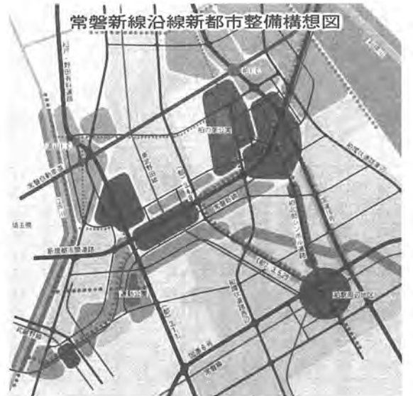
プロジェクト4 北部地域 総合整備