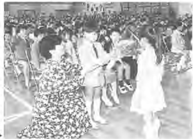
松葉第二小学校の入学式

4月10日、市内33の小学校で入学式が行われ、3,729人の新一年生が誕生しました。