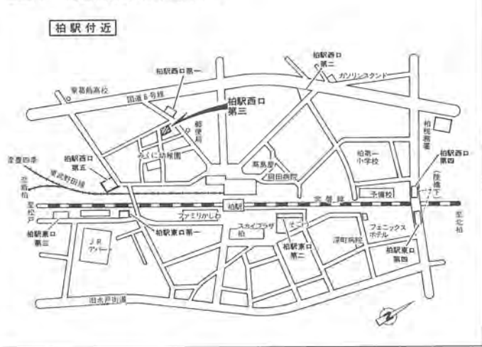
図1 市営自転車駐車場案内図

山公園近く・別図4)もオープンします。 いずれの場所とも、農家のこたが昨年十月、種をまいて以来丹精こめて育ててきたもので、会場一面まるでピンク色のじゅうたんを敷きつめたように、レンゲの花がいつぱい咲きます。 五月のゴールデンウィークには、ご家族いっしょでお近くの「レンゲの里」などにお出かけになり、レンゲ摘みなどで春のひとときをお過ごしなうか。 問い合わせ 農政課