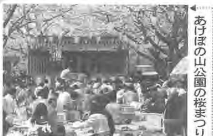
あけぼの山公園の桜まつり 4月6日、あけぼの山公園で桜まつりが開かれ、おおぜいの人でにぎわいました。