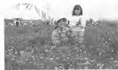
レンゲ摘みはいかが