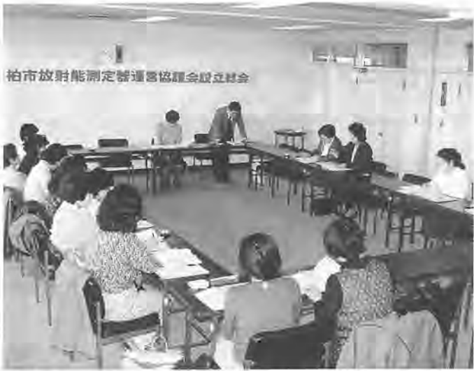
市内の消費者・市民団体の代表が集って開かれた総会