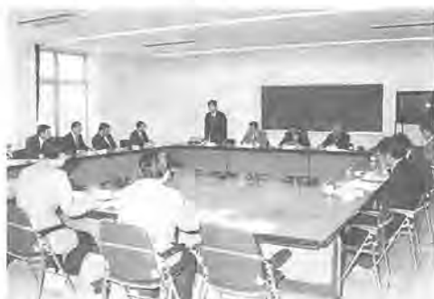
各事業所から事例が発表されました

二月十五日、新清掃工場 で、市内デパート・スーパー マーケット等、食料品を扱っ ている十の大型店の代表者が 参加して、ごみ減量懇談会が 開催されました。 これは、市のごみの中で、