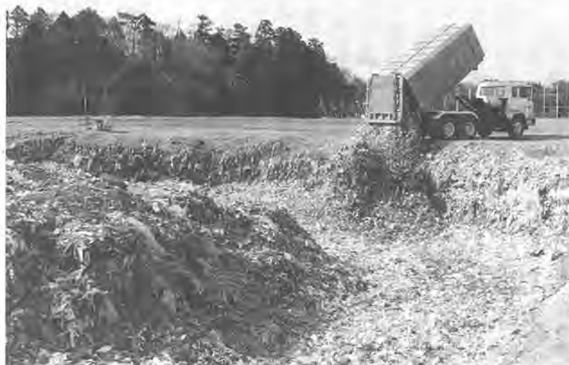
埋め立て用地が残りわずかとなった現最終処分場