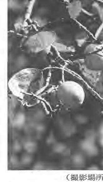
(撮影場所: 柏五丁目)

から悠々と暮らした先人たちの姿が、この言葉にはある。慌ただしい毎日を送る私たちの生活でも、決して忘れてはならないことだ。 葉もまばらになっ た枝に下がる、熟したカキの実。真っ赤に火照るその肌には、秋の夕日がよく似合う。太陽の最後の輝きに照り映えて……。