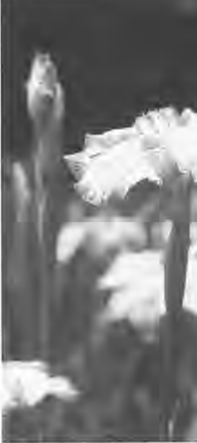
(撮影場所：水生植物園)

どんよりと低く垂れ込める黒い雲。そしてひとたび降り始めると、とめどなく降り続く雨。 また今年も、傘を手放せないうつつとしい季節がやって来た。何をやるにも、