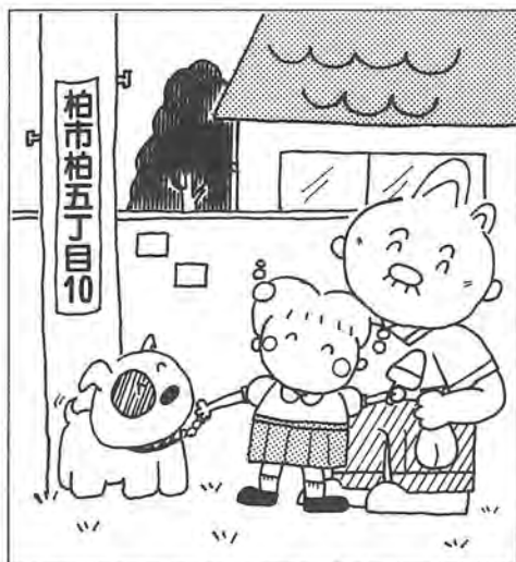
街区の電柱に付けられる街区表示板

せ、大変便利になります。今まで、住所が分りにくかったため、知人宅を訪ねてもなかなか家が見つからなかったり、いろいろな配達物が遅れて届いたなどの経験をされた方も多いと思います。特に火災