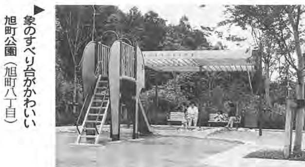
家のすべり台がかわいい 旭町公園(旭町八丁目)

このほど、並木第二・旭町の二つの公園が開園しました。公園はわたしたちの貴重な財産です。木や花などを大切に、皆さんでご利用ください。