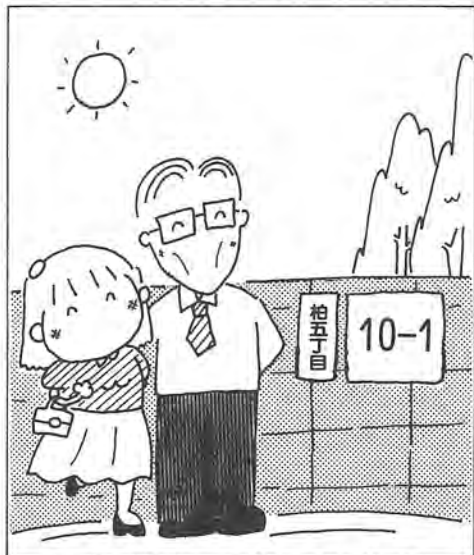
各家に付けられる住居番号表示板