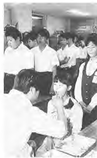
大きく口を開けて入念に検査