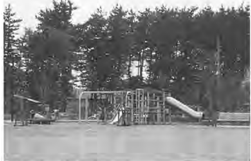
二つの広場がある 並木第二公園(逆井一六九二)

今回住居表示が実施されるのは、住所の表示が複雑になっている南部地域一帯(II別図1)で、約一万三千世帯について整備する予定です。これらの地域は、急速に進む宅