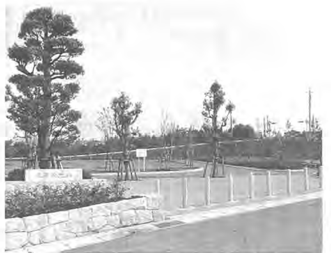
憩いの場として利用される北部緑地

私たちが、快適で健やかな日常生活を過ごすうえで、なくてはならないものに「緑」と「水」があります。「緑」は、私たちに潤いと安らぎを与え、「水」は、私たちの生命の源となります。現在、柏市は、「豊かな緑と水のふるさとづくり」を理念とするアメニティ・タウン計画に基づき、自然と都市機能がよく調和したまちづくりを展開中です。今号では、この計画に沿って進められてきた緑地整備事業と湧水(ゆうすい)の保全・整備事業のうち新たに市民に開放されることになった北部緑地と三つの湧水の概要をお知らせします。休日には、ご家族連れで身近な自然と親しんでみませんか。