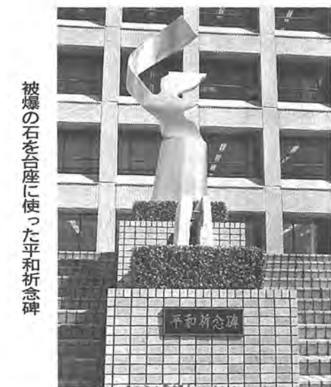
被爆の石を台座に使った平和祈念碑