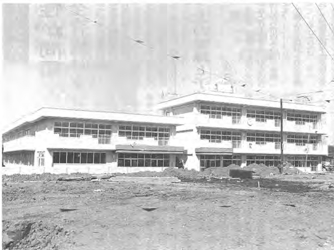
完成間近な豊四季中学校

四月に市内で十六番目の中学校として「豊四季中学校」が開校します。豊四季中学校は、柏中学校の過大化を解消するために開校するもので、生徒数八百三人、学級数二十一学級規模の中学校になる予定です。また、学校用地の取得は、たいへん厳しい状況でしたが、地権者のかたの協力でスムーズに行うことができました。なお、通学区域、名称と所在地は、平成元年第一回定例市議会で決定したもので