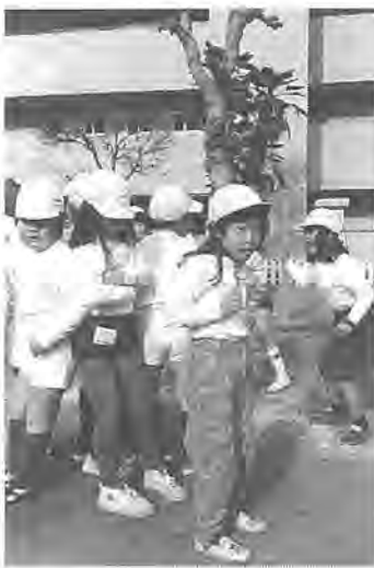
児童手当制度は、次代を担う子どもたちが健全に育つことを目的に設けられたものです。

申請は随時受け付け、申請に必要書類を揃えて、市役所市民生活課(電話64-1757)へ提出してください。