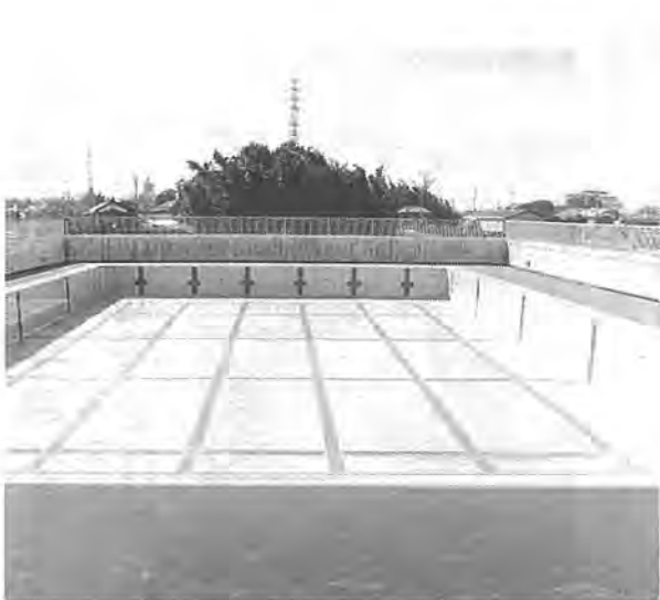
市内の中学校で初めての屋上プール