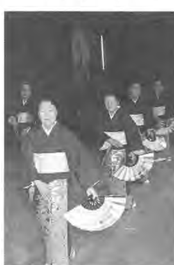
おそろいの着物で大奮闘

【柏市長賞】松寿クラブ 【柏市老人クラブ連合会長賞】光老会 【柏市議会議長賞】あかねクラブ 【柏市社会福祉協議会長賞】明寿会 【柏市民生児童委員協議会長賞】花野井百寿会 【敢闘賞】つくし会 【アイデア賞】西原第一老人クラブ 【シルバー賞】富寿会 【努力賞】長寿クラブ 【熱演賞】二三三会 以上十チーム。