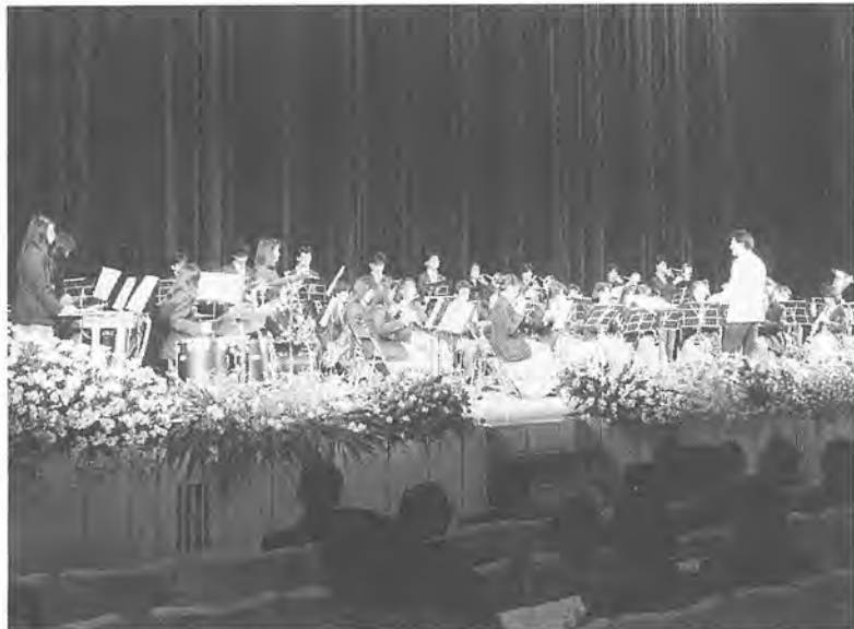
すばらしい演奏を披露した市立高校吹奏楽部のみなさん