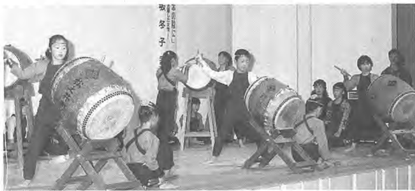
アトラクションでみごとな演奏を行った南部太鼓愛好会のみなさん

な活動が展開されていいます。こうした地域活動に対し、来賓としてあいさつに立った市長は、日ごろの活動に対して感謝と敬意を表したあと、地域が自ら考え、実践し、より充実した地域社会に向けて、さらに前進して欲しいと、連絡会議に対する期待を述べました。