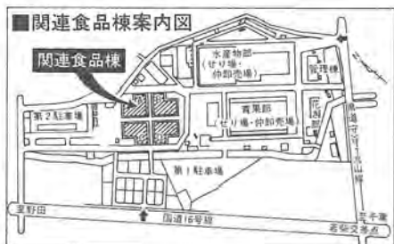
関連食品棟案内図