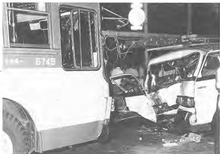
悲惨な交通事故はもうたくさん

八月までに発生した交通事故 十五人、けがをしたかたは十三人のなかで、けがをしたり、一人にもなり、昨年同期と死んだりする人身事故は、比べ、発生件数は、百四十三件二十四件で、けがは増えています。