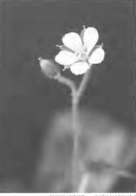
(撮影場所：利根川堤防)

秋晴れの午後、利根川堤防沿いを散策してみる。いろいろな光景に出会って、結構楽しいものだ。ジョギングしている人もいれば、野花を摘んでいる家族連れの様も見かける。