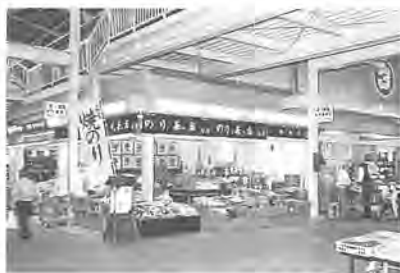
利用しやすい模様替え

市民の皆さんの日常生活に欠かせない生鮮食品を、安食品棟が、模様替えしてこのほど完成。十月二十六日から六十店。 約七十店舗が参加して、特価セールを行います。 同市場内には、青果・水産・花きなどの生鮮品のほかに、食肉・お茶・海苔（のり）・お菓子・乾物・漬物などを扱う関連食品店舗が約六十店。