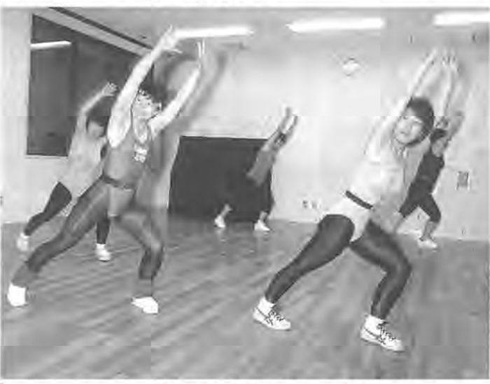
週に1回エアロビクスでいい汗かいています

▽児童センター「料理クラ ム」 とき 6月11日(日)午前 8時半から同センターへ費用