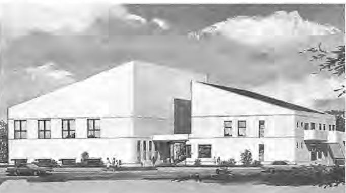
(仮称) 酒井根地区近隣センター完成予想図