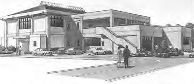
(仮称) 大青田・船戸地区近隣センター完成予想図