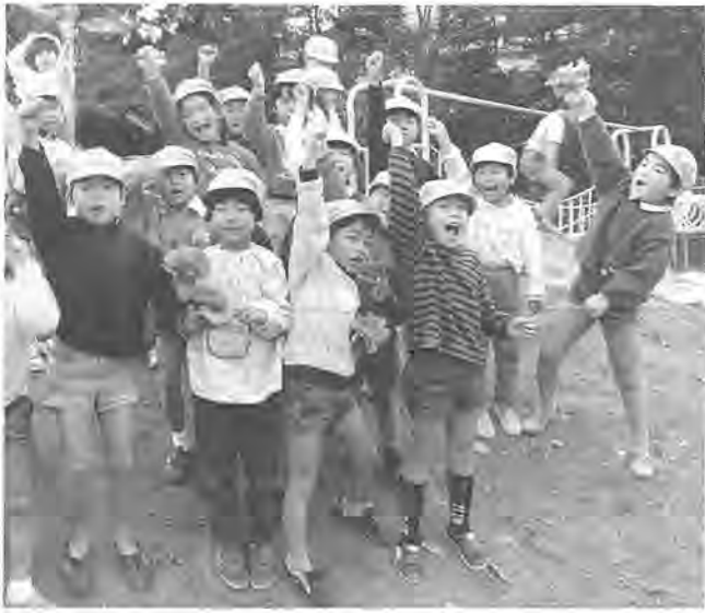
ほくらは元気のかたまりだ

そこで、市では、四歳児と五歳児を対象に幼児体育教室を開きます。この教室は年間を四期に分けて開催し、野外運動、水泳、ボール運動、親子体操などを行い、親子で参加します。今回は、第一期として、運動能力テストや野外運動に参加する親子五十組百人を募集します。ぜひご参加ください。なお、第二期以降の開催時期と実施内容は次のとおりです。開催時期が近づきましたらお知らせします。