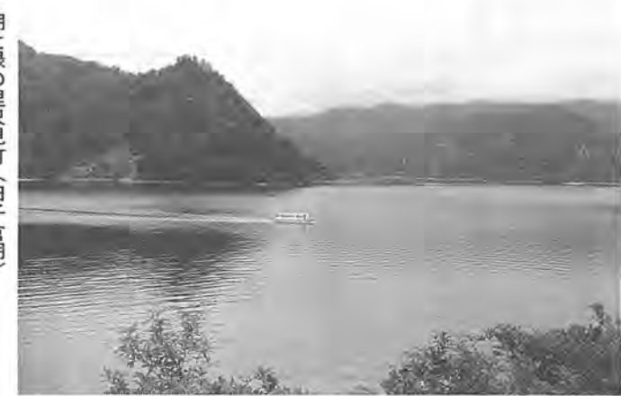
湖と緑の里只見町(田子倉湖)

昭和三十六年から、福島県只見町と永楽台近隣センター運営委員会の間で、また、昭和六十二年から、茨城県大子町と西十倉二地区近隣連合会の間でそれぞれ、ふるさと村交流を行ってまいりました。 表3のとおり ▽協定料金と助成額 別表3のとおり ▽申し込み コミュニティ課・只見町永楽台近隣センター(☎63-1100)・大子町(☎54-1100) ▽西原近隣センター(☎54-1100)