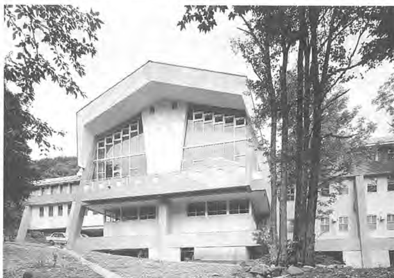
自然を満喫できるかしわ荘