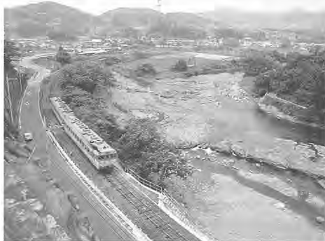
袋田の滝や温泉もある大子町(水郡線)

【利用上の注意】 4月10日(月)から20日(木)まで施設整備のため、かしの荘は、サービスの充実にご協力をお願いします。 ☆ふるさと村交流 恵まれた自然と素朴な風情にひたることのできる『ふるさと村』を訪ねてみてはいかがでしょうか。