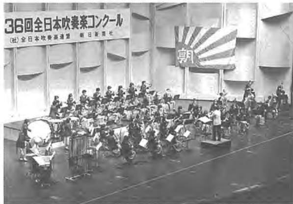
二度目の金賞に輝いた柏高吹奏楽部

年の柏の星」でした。同校野球部は、夏の全国高等学校野球選手権大会で、三年に輝きました。また、同校吹奏楽部は、全