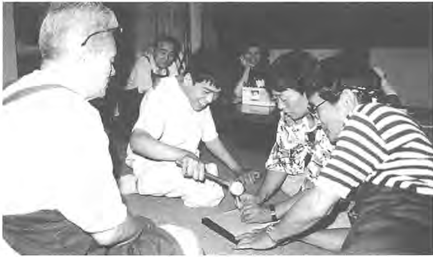
力を合わせれば、何でもできるはずです……