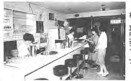
柏っ葉喫茶コーナー

十二月九日(金)は「障害者の日」。障害者や、障害者を取り巻く環境を見つめ直す日です。昭和五十六年の「国際障害者年」以来、障害者に対する社会の反応は、大きく変わってきているように思われます。ボランティアの講座やスクールには、多くの人々が申し込み、盛り上がりを見せているように思われます。しかし、障害者の実際については、教科書で勉強したり、講座を受けただけでは分かりません。実際に触れ合ってみなければ、障害者が何を考え、何に困っているのかが分かりません。今号では、できるだけ障害者の立場に立つた視点から、今、何が問われているのかを考えてみました。結論は出せませんが、皆さんが障害者の問題を考える上での、一助になれば幸いです。