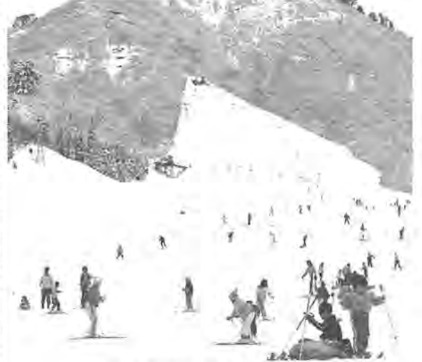
雪の豊富な只見スキー場