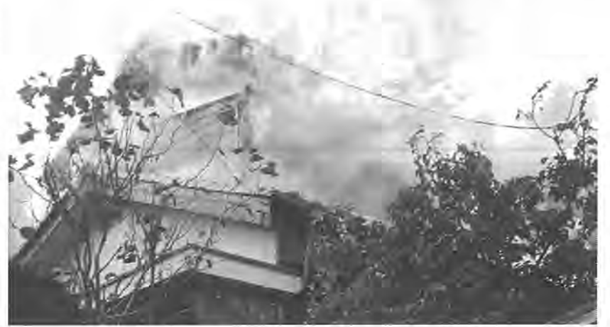
これからは、火災が増えるシーズンです

【危険物施設の維持管理講習会】 とき 11月29日(火) 午後1時〜5時 ところ 文化館小ホール 問い合わせ 柏市消防本部 33-0119 【第7回 かしわ葉福祉まつり】 障害者と健康者が心の交流を深める とき 11月26日(土)・27日(日) ところ 教育福祉会館 内容 ベドロ&カプリシヤスコンサート(26日) ・「15少年漂流記」映画会(27日) などたくさん催しがいっぱい! 問い合わせ 社会福祉協議会 63-9001