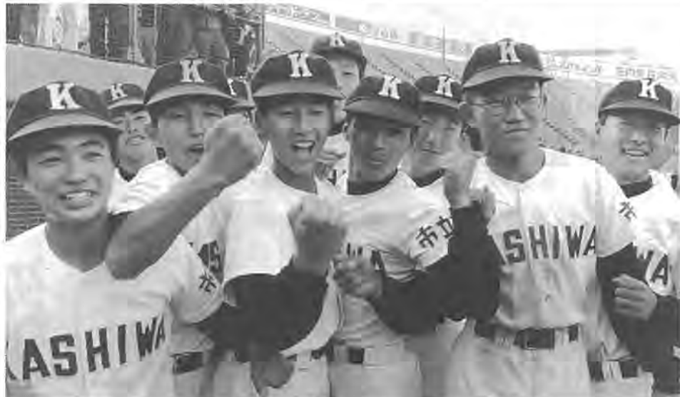
やった！今度は甲子園でがんばるぞ

第四十回秋季関東地区高等学校野球大会は、千葉、埼玉、茨城など七県の各予選を勝ち抜いてきた代表十五校が参加し、十一月三日から行われました。市立柏高校も、ブルック予選、県大会を勝ち進み、決勝で八千代松陰高校には敗れましたものの、関東地区大会へ千葉県代表として初出場を果たしました。 来春の選抜高等学校野球大会へ出場するための重要な大会となる関東地区大会。一回戦、前橋商業高校（群馬）を3対2、二回戦、東京農大第三高校（埼玉）を8対0、準決勝、横浜商業高校（神奈川）を10対5で破り、決勝に進出しました。