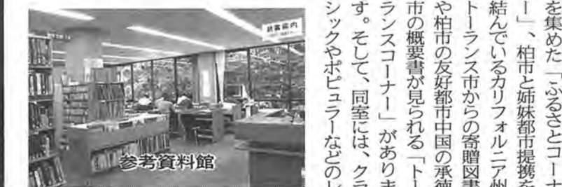
コンピュータで図書の検索