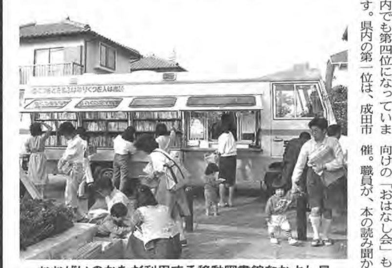
おせいかたが利用する移動図書館なかよし号