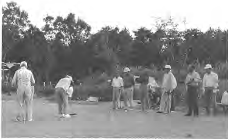
健康でいられるのが一番ですが...

医療費は総額50億円 ①老人保健医療受給者は、一万二千三百人。前年度比、八・三四%の増加②医療機関で治療を受けた老人医療費の総額は、五十億九千八百万円。前年度比、一〇・六八%の増加(現金給付・調剤を除く)③老人保健医療受給者一人当たりの医療費は、四十二万三千七百円。前年度比、二・一六%の増加④受診一件当たりの医療費は、三万四千二百五十円。前年度比、四・三六%の増加⑤老人保健医療受給者の、一人当たりの受診件数は、十二・三九件。前年度比、二・一三%の減少見込みとなりました。また、医師の指示のもとに治療上行ったコルセットの装着、付き添い看護や柔道整復などにかかった医療費(現金給付分)は、一億九千三百五十三万六千円。前年度比、八・五八%の増加見込みとなりました。