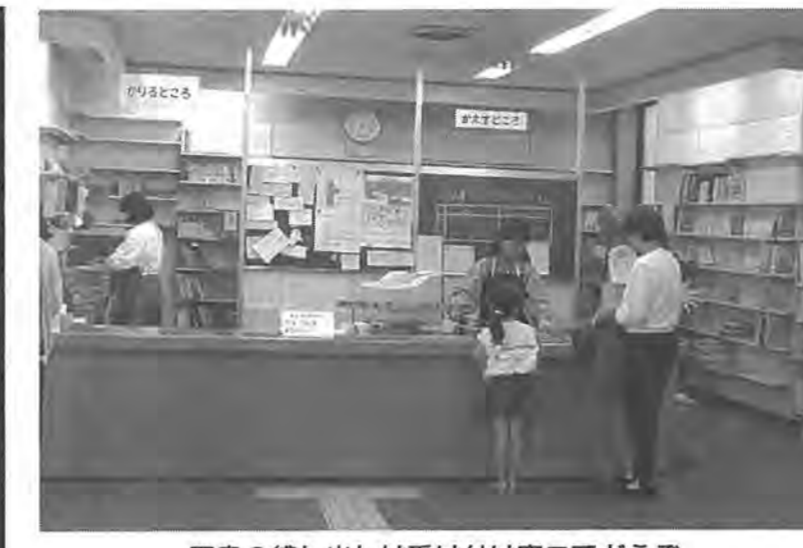
図書の貸し出しは受け付け窓口でどうぞ

市内に図書館は15カ所。市立図書館が本館と分館十四カ所を合わせて、十五カ所あります。分館は、豊四季台分館と根戸分館を除き、近隣センターと併設されています。近隣センターは、ほかに体育館などの施設があり、地域活動の拠点として、おせいかたに、利用されています。本館と分館は、昭和十五年からすべて、コンピュータ・オンラインシステムを導入しています。これにより、利用者カード一枚で、本館・分館・移動図書館でも、待たずに図書