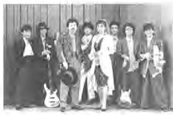
ペドロ&カプリシャス

十一月二十六(土)・二十一年開かれています。ご家族、七(日)の二日間、教育福祉お友達などお誘い合わせのついでに、第七回「かしわっ葉福祉まつり」が開催されます。このまつりは、障害者と健常者が楽しい催しを通して、互いに理解し心の交流を深めていただくこと、毎