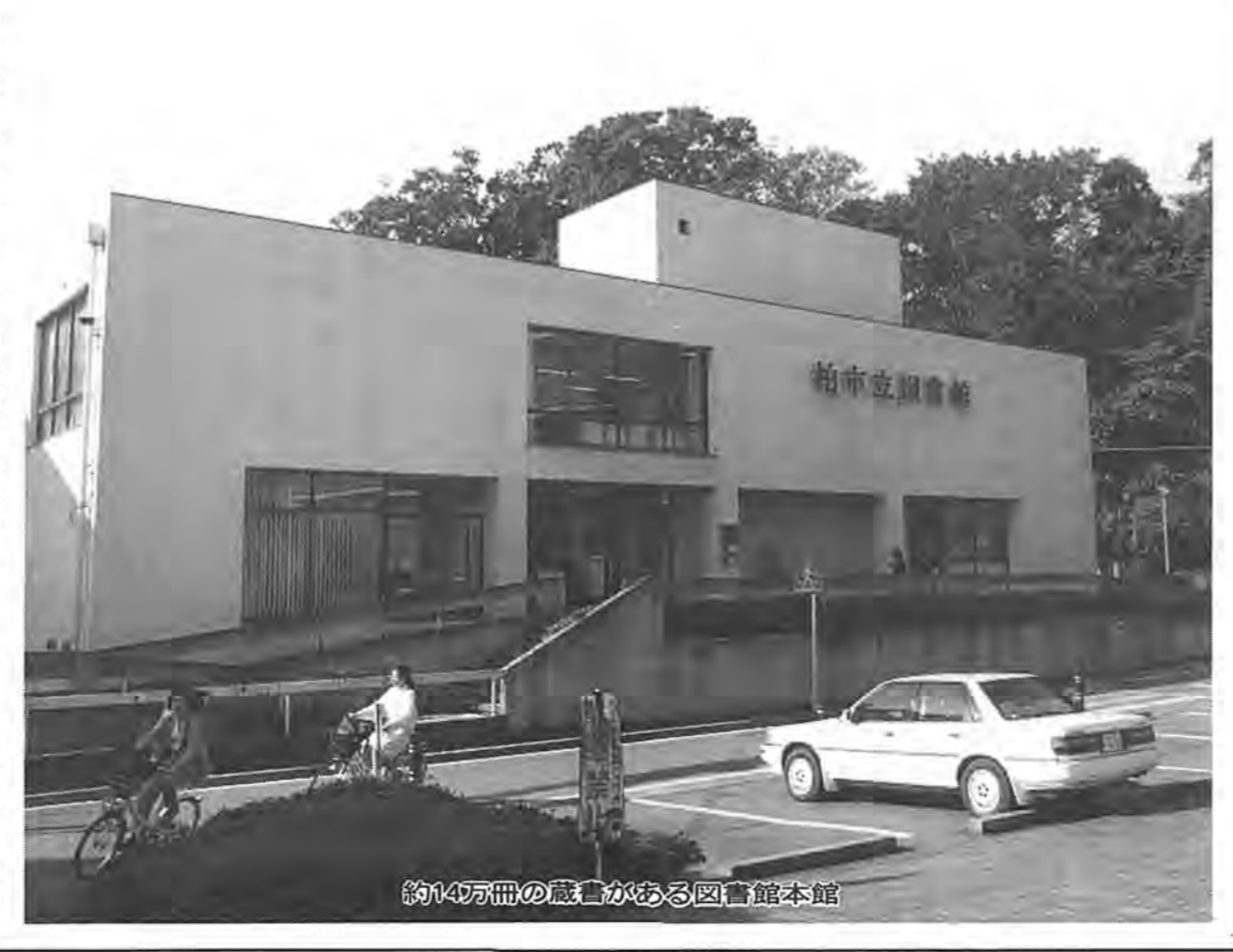
約14万冊の蔵書がある図書館本館

「おはなし会」の対象は三回連続して参加できるお母さん(五、六、七歳)と子ども(三歳以上)の親子です。また、読書会に参加したかたは、自主的に作られた読書会が主として、読んでいく本の分野、読書の幅を広げていきます。また、本館と分館では、市民催した、文学の講演会などに参加したかたが、自主的に作られた読書会が主として、読んでいく本の分野、読書の幅を広げていきます。