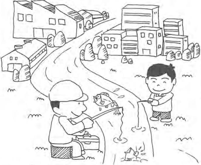
表3 追加された規制対象事業場

手賀沼や大堀川などの公共用水域の水質を一層改善するために、十月一日から一定規制が加されました。