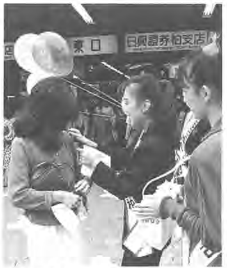
あなたの善意が支えます(昨年の募金活動)

十月一日から十二月三十一日まで、全国一斉に「国民たすけあい共同募金運動」が実施されます。