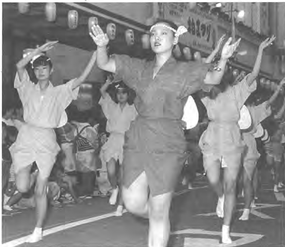
毎年熱戦が繰り広げられる柏おどりコンテスト (昨年の柏まつりから)