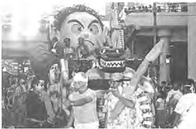
趣向をこらした花自動車がいっぱい