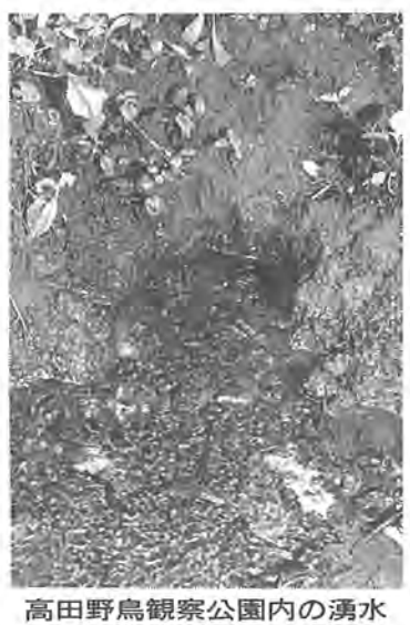
高田野鳥観察公園内の湧水

まもなく三十万都市の仲間入りをする柏市にも、市内の河川や手賀沼の周辺には、まだ数多くの貴重な自然が残っています。 柏市では、「快適な街づくりを進めるため、昭和六十