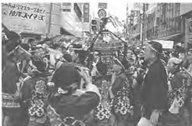
わっしょいわっしょい おみこしのお通りだい!