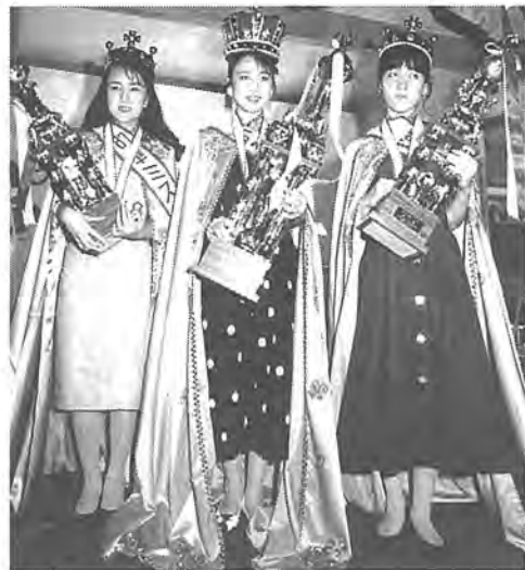
今年のミス柏の栄冠はだれの手に!