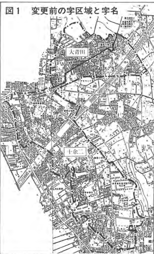
図1 変更前の字区域と字名

市では、大青田・十余二の大字(別図1)に変わり、別各一部(約一・五七平方キロ 図2のとおり新たに、みどり台、四千七百世帯)の区域に 台一〜五丁目、伊勢原一丁目、住居表示を実施する 目、西原一〜七丁目、西柏台のための準備を進めてきました。一・二丁目の町名とすること。また、六月市議会で、字 になりまし。実施は、来年一月一日を予定して審議、可決され、従来の 定しています。これから市で 問い合わせ 市民課