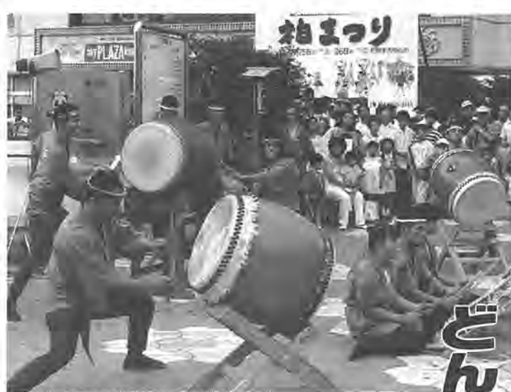
太鼓と踊りで柏まつりが開幕