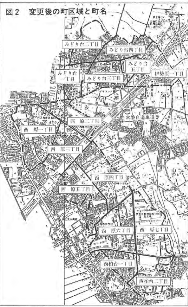
図2 変更後の町区域と町名

市では、大青田・十余二の大字(別図1)に変わり、別各一部(約一・五七平方キロ 図2のとおり新たに、みどり台、四千七百世帯)の区域に 台一〜五丁目、伊勢原一丁目、住居表示を実施する 目、西原一〜七丁目、西柏台のための準備を進めてきました。一・二丁目の町名とすること。また、六月市議会で、字 になりまし。実施は、来年一月一日を予定して審議、可決され、従来の 定しています。これから市で 問い合わせ 市民課