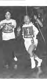
缶釣り競争でハッスル