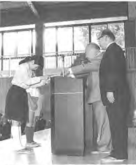
教育長から認定書を受け取る両校の代表者

みどりを愛し、みどりを育む。進め委員会が中心になって約三目的にした「柏すみどりの少年団」が、このほど富勢東小学校と田中小学校に誕生し、その結団式が十一日、青少年センターで行われました。